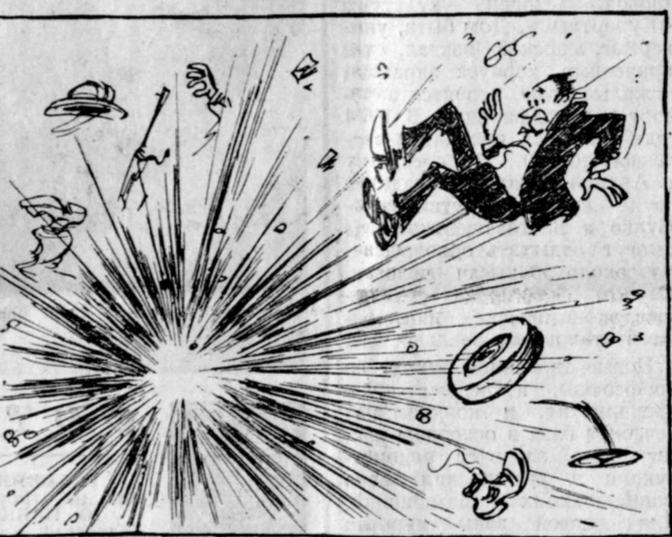
Рис. Д. Агаева.