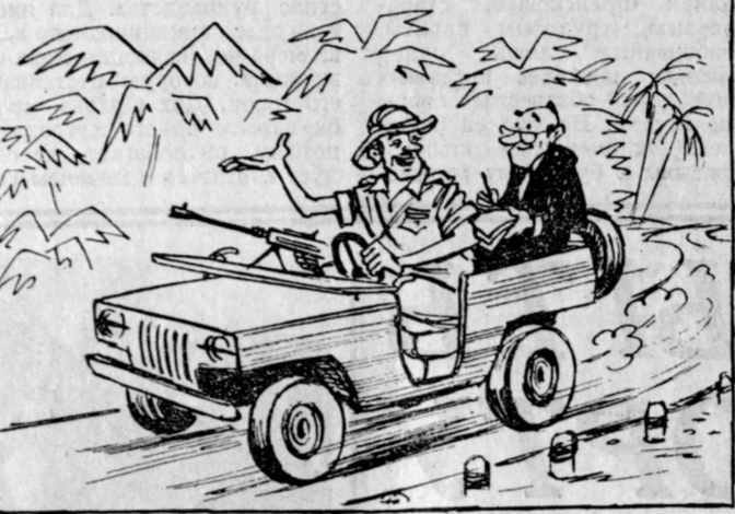
Мы контролируем всю территорию Мозамбика.