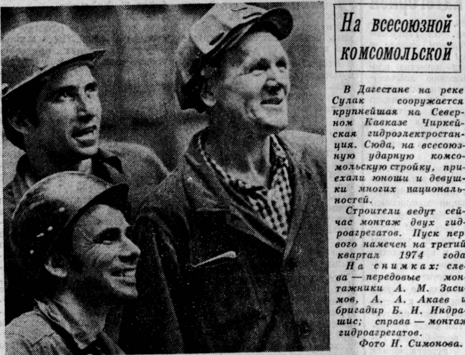
На всесоюзной комсомольской

Коллегия Министерства легкой промышленности СССР обсудила задачи, вытекающие из постановления ЦК КПСС, разработала меры по улучшению качества и ассортимента товаров, производству их в соответствии с растущим спросом населения.