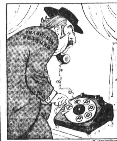
Главная линия связи заговорщиков. Рис. М. Абрамова.