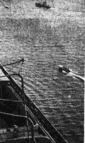
ЕЖЕДНЕВНО и прина- лам Херсонского новобината хлебопродуктов швартуется судя. Здесь все трудоемкие процессы по разгрузке хлеба автоматизированы. Коллектив элеватора принял повышенные обязательства по досрочной разгрузке поступающего зерна. На с и м и з х. сверху — дежурный инженер Галина Гросул руководит разгрузкой очередного судна; справа — под разгрузкой теплоточка «Влас Чубарь».