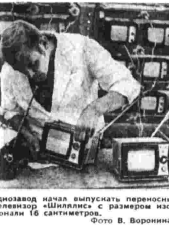
Каунасский радиозавод начал выпускать переносный транзисторный телевизор «Шиллис»...