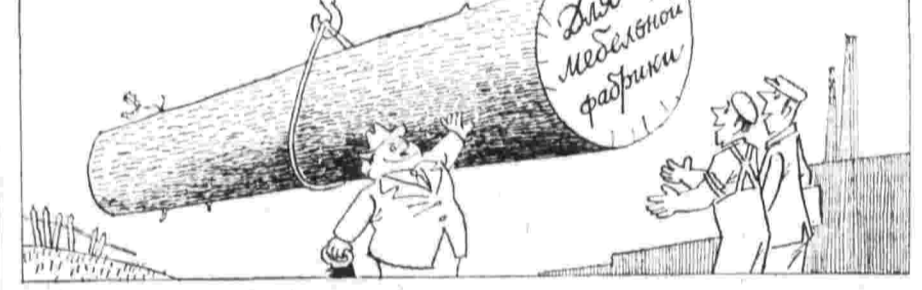
— Получите вашу долю древесных твердых пород...