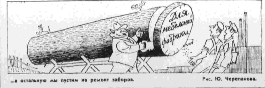
...а остальную мы пустим на ремонт заборов. Рис. Ю. Черепанова.