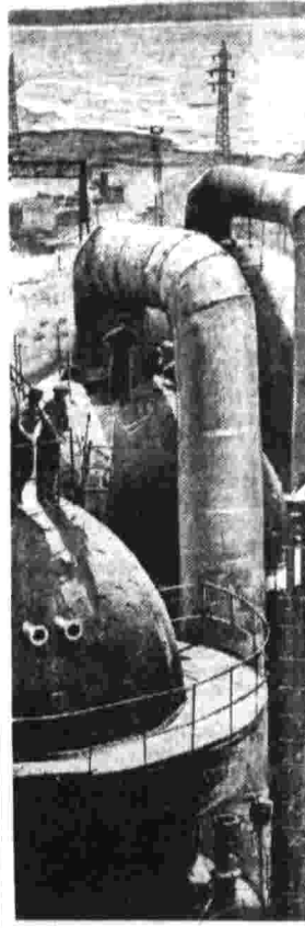
УЗНОЙ полоской между высокими красноватыми горами и Каспием протянулся узкий Краснодарский. Горы растут, и с каждым годом увеличивается его потребность в пресной воде.

А. СИМУРОВ. (Корр. «Правды»). Белорусская ССР.