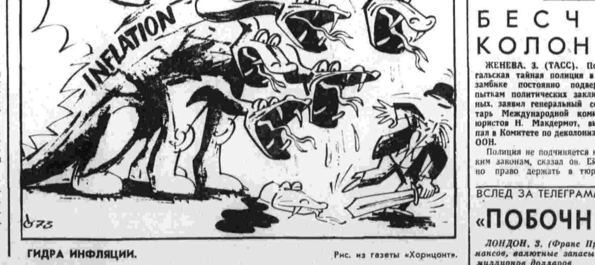
Гидра инфляции. Рис. из газеты «Хоррионг».

◆ ПРОВОДЯТ КАНИКУЛЫ В ЛЕТНИХ ЛАГЕРЯХ около 60 тысяч старшего поколения ЕДР. Юноши и девушки побойт крестьянских хозяйств в уборке урожая овощей и фруктов, трудятся на стройках, участвуют в спортивных соревнованиях, вечерах художественной самодеятельности. ◆ ТРАДИЦИОННАЯ КАМПАНИЯ по сбору средств в фонд коммунистической печати, предшествовавшая празднику газеты «Юманите», успешно проходит сейчас в Париже и прилегающих к нему департаментах. ◆ В РЕЗУЛЬТАТЕ ВЗРЫВА ВОМВЫ два человека ранены в городе Ньютаун-Гамелтон (Восток). Взрывом бомб проломил также в Дерри и других севернорландских городах.