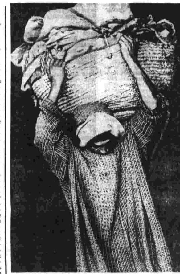
Заседание комиссии Л. ИНГЕБОРГ (Франция). Тяжелая ноша.

Известно, однако, что в Западной Европе есть силы, которые все это не по душе. Есть они и в социал-демократическом движении. Обращая на себя внимание политиков, заставив председателем Социал-демократического интернационала Б. Питтерманом в последние время он не упускает случая выступить с нападениями на социалистические страны, на коммунистическое движение, призывает к борьбе против «коммунистических режимов», предостерегает социал-демократов от сотрудничества с коммунистами, вопреки истине разлагает коммунистов «под влиянием коммунистов Западной Европы» и т. п.