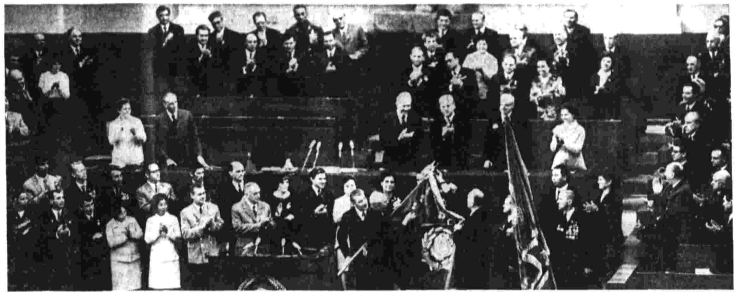
На знамени РСФСР — орден Дружбы народов.

Встреча Л. И. Брежнева и Э. Хонеккера прошла в сердечной, дружеской обстановке и характеризовалась полным единством взглядов по всем обсуждавшимся вопросам.