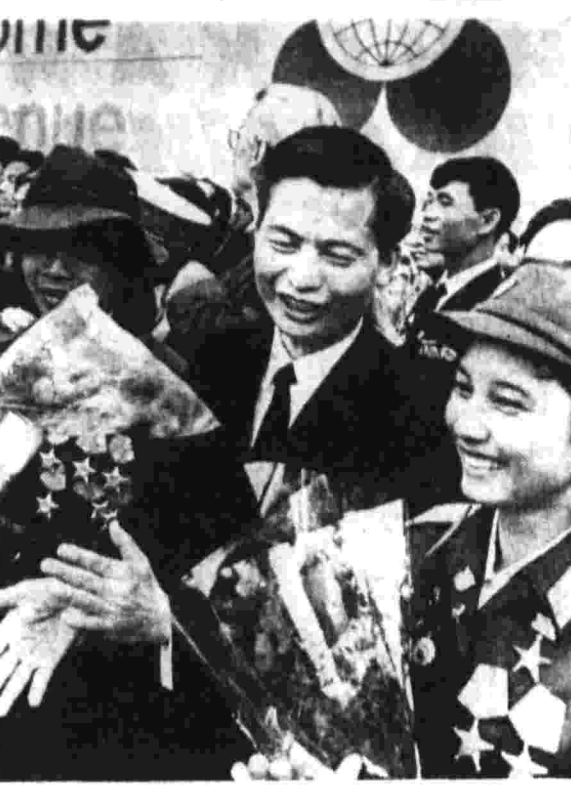
Патриоты Вьетнама. В Берлине это ощущается на каждом шагу. Идея солидарности...