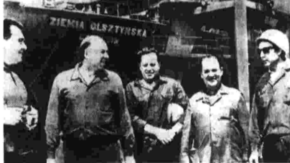
БОЛГАРИЯ. Крепкая дружба Болгарии и дружбы ее сограждан в мире после окончания первого этапа работы Советско-Болгарского комитета.

Агрессивные военно-политические блоки, созданные империалистическими государствами в Азии и районе Тихого океана, переживают глубокий кризис.