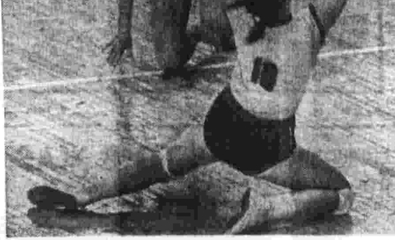
ФОТОКОНКУРС «ПРАВДЫ» Острый момент.