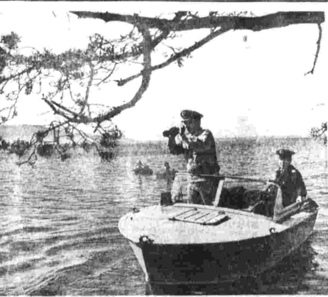
На снимке справа — район озера Байкал, в центре — озеро Байкал, в центре — озеро Байкал.