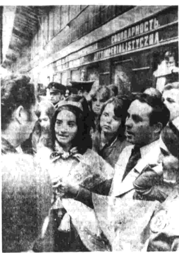
Посланные советской молодежью в Берлине. Гетеросп. корр. «Правды» В. Кружков.

Десять раз открывалась юности планеты на всемирных фестивалях молодежи и студентов. Этот фестиваль — десятый. Впервые ГДР уже второй раз становится местом проведения международного молодежного фестиваля. 28 июля во второй половине дня фестиваль открывается в Берлине. Это знаменитый мир в дружбе — значит мир в дружбе. На праздничных вечерах в Берлине, почти на протяжении десятилетия, встречались и дружили представители молодежи из разных стран. Юноши и девушки встречались и дружили, общались и соприкасались в танцах, играх, в спорте, в совместном творчестве. Они общались и дружили, общались и соприкасались в танцах, играх, в спорте, в совместном творчестве. Они общались и дружили, общались и соприкасались в танцах, играх, в спорте, в совместном творчестве. В Берлине в этот вечер встретятся представители молодежи из более чем 100 стран. Это будет самый большой международный молодежный фестиваль в истории. Впервые в Берлине встретятся представители молодежи из всех континентов. Это будет самый большой международный молодежный фестиваль в истории. Впервые в Берлине встретятся представители молодежи из всех континентов. В Берлине в этот вечер встретятся представители молодежи из более чем 100 стран. Это будет самый большой международный молодежный фестиваль в истории. Впервые в Берлине встретятся представители молодежи из всех континентов.