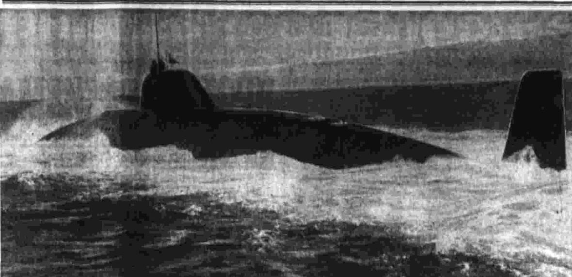
В вооруженных силах страны широко развирнулось социалистическое соревнование...