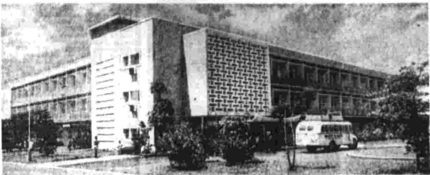
Госпиталь в Кисуму, построенный с помощью Советского Союза, — одно из лучших медицинских учреждений Кении. Здесь трудится группа советских врачей, помогающая налаживать систему здравоохранения, создавать национальные кадры. На снимке: общий вид главного корпуса госпиталя.