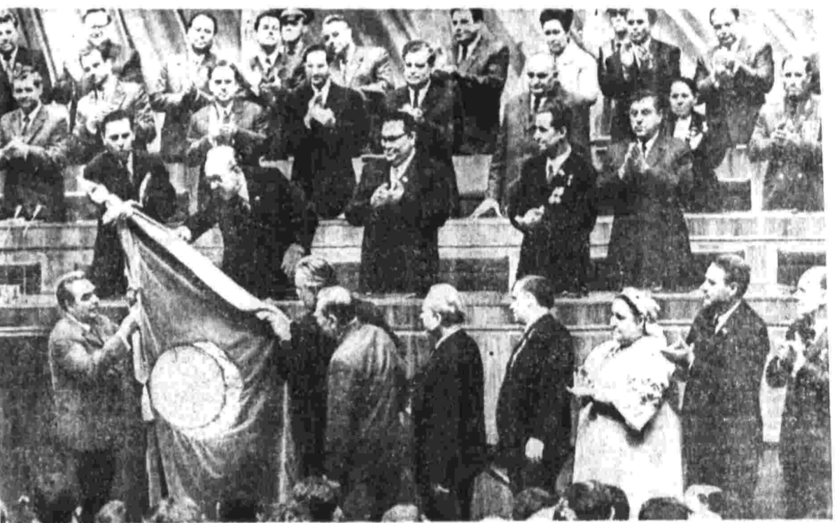
На знамени Украинской ССР — орден Дружбы народов.

Торжественное заседание открыл Председатель Президиума Верховного Совета Украинской ССР И. С. Грушецкий. Мы собрались, сказал он, по случаю знаменательного радостного события — вручения Украинской Советской Социалистической Республике четвертой награды Родины — ордена Дружбы народов. Нам особенно приятно и