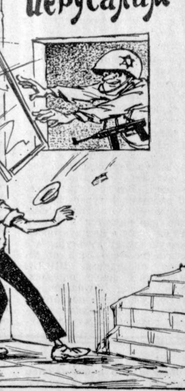
Рис. Д. Гаева.