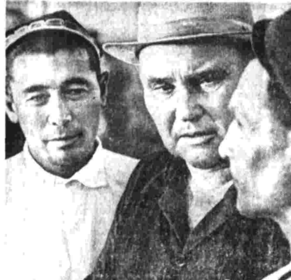
С большим подъемом трудятся хлопководы Узбекистана. Они решили продать государству 4 миллиона 730 тысяч тонн хлопка-сырца...