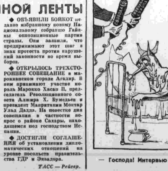
Господа! Интервью у нее вы сможете взять после укола!