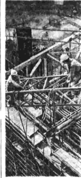
БОЛГАРИЯ. В нескольких километрах от города Козлодуй сооружается первая болгарская атомная электростанция.