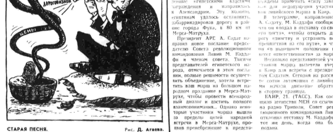
СТАРАЯ ПЕСНЯ. Рис. Д. Агеева.

цены на продукты в странах капитала продолжают неуклонно расти.