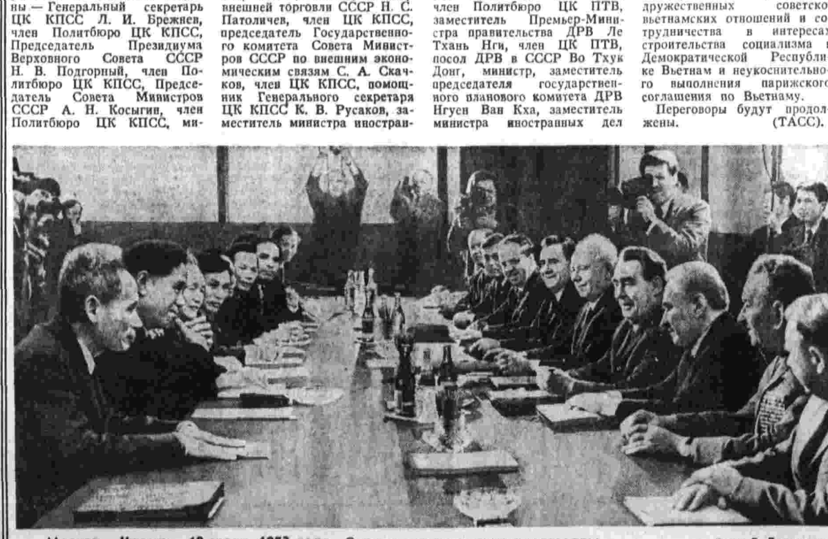
Москва, Кремль, 10 июля 1973 года. Советско-вьетнамские переговоры.

с вьетнамской стороны — Первый секретарь ЦК Партии трудящихся Вьетнама Ле Зуан, член Политбюро ЦК ПТВ, Председатель правительства ДРВ Фам Ван Донг, член Политбюро ЦК ПТВ, заместитель Премьер-министра правительства ДРВ Ле Тхань Нги, член ЦК ПТВ, посол ДРВ в СССР Во Тхук Донг, министр, заместитель председателя государственного планового комитета ДРВ Нгуен Ван Ка, заместитель министра иностранных дел