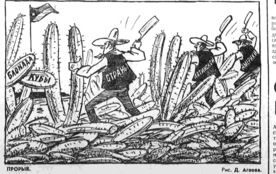
Рис. Д. Агаева.

Руководители НКТ сообщили также, что в настоящее время профсоюз страны, прогрессивная коалиция — Широкий фронт, оппозиционная национальная группа палатской партии «Колор» стремятся выработать общую программу борьбы за восстановление конституционного порядка.