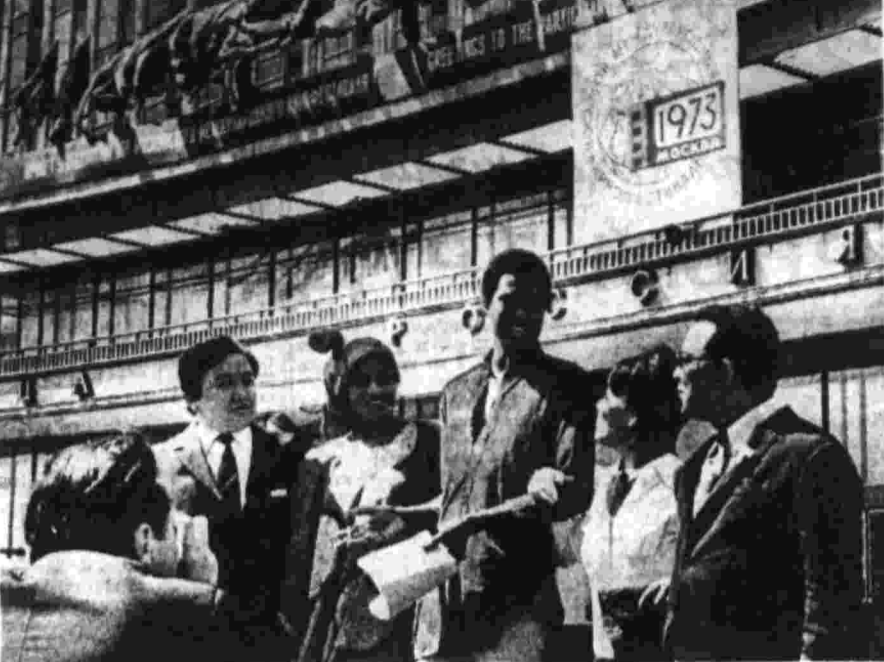
Участники и гости VIII Московского международного кинофестиваля — представители Монгольской Народной Республики, Сенегала, Японии и Туниса у гостиницы «Россия».

Ф. ЕРМАШ. Председатель оргкомитета кинофестиваля, председатель Госкино СССР.