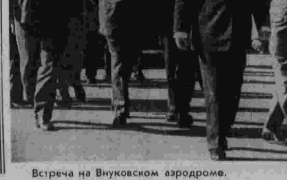
Встреча на Внуковском аэродроме.

17.00. Специальный самолет подруливает к зданию аэропорта. По трапу спускаются товарищи Ле Зуан, Фам Ван Донг, другие члены делегации ПТВ и правительства ДРВ. С ними сердечно здороваются советские руководители.