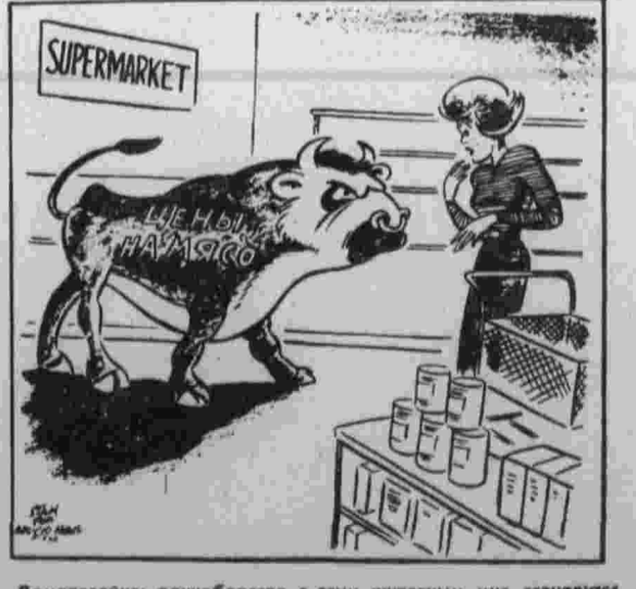
Довольна: единоборство с этим животным мне становится все не под силу. Рис. из газеты «Дейли уорлд».

Митинги, собрания, вечера, посвященные месячнику солидарности, состоялись также в Алма-Ате, Хабаровске, других городах страны. (ТАСС).