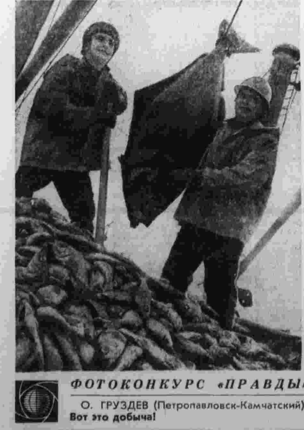
ФОТОКОМКУРС «ПРАВДЫ» О. ГРУЗДЕВ (Петропавловск-Камчатский). Вот это добыча!