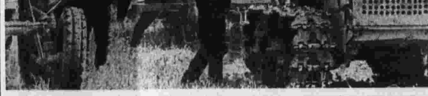
И в с и м м е: Механизаторы перестартов. Фото Ю. Ингичина («Ленинская правда»).

Н. ГЛАДКОВ. (Корр. «Правды»). Узбекская ССР.