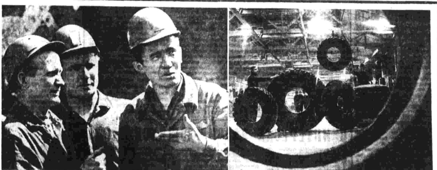
Ключ к успеху — в наших руках. На снимке: первые белорусские шины.

Время и его наиболее значительные события, постигшие художественно, несут в себе черты своего выражения в величавом эпитетическом слове. Эпос создается автором, но пишется в себя коллективный исторический, философский и эстетический опыт. Самые широкие круги читателей встретились в разное время в разные годы. Современный читатель проявляет большой интерес к крупным поэтическим произведениям.