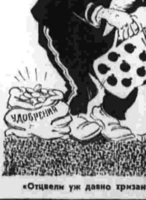
«Отдали уж давно хризантемы в саду...»

Углубляется кризис агрессивных военно-политических блоков СЕАТО, АЗПАК и АНЗЮС.