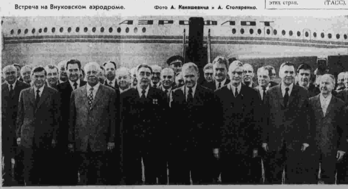
Встреча на Внуковском аэродроме.