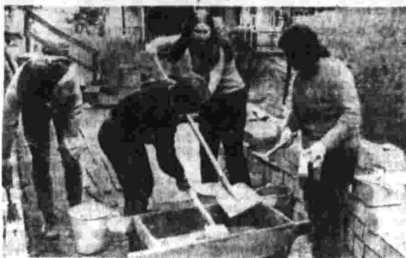
Прогрессивная молодежь Западного Берлина активно готовится к X Всемирному фестивалю молодежи и студентов. По инициативе Союза свободной немецкой молодежи решено собрать 100 тысяч марок. Этим ценой служат, в частности, фестивальные суботники.