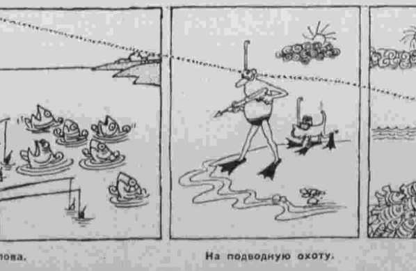
Кто кого? Рисунок В. Волнова.