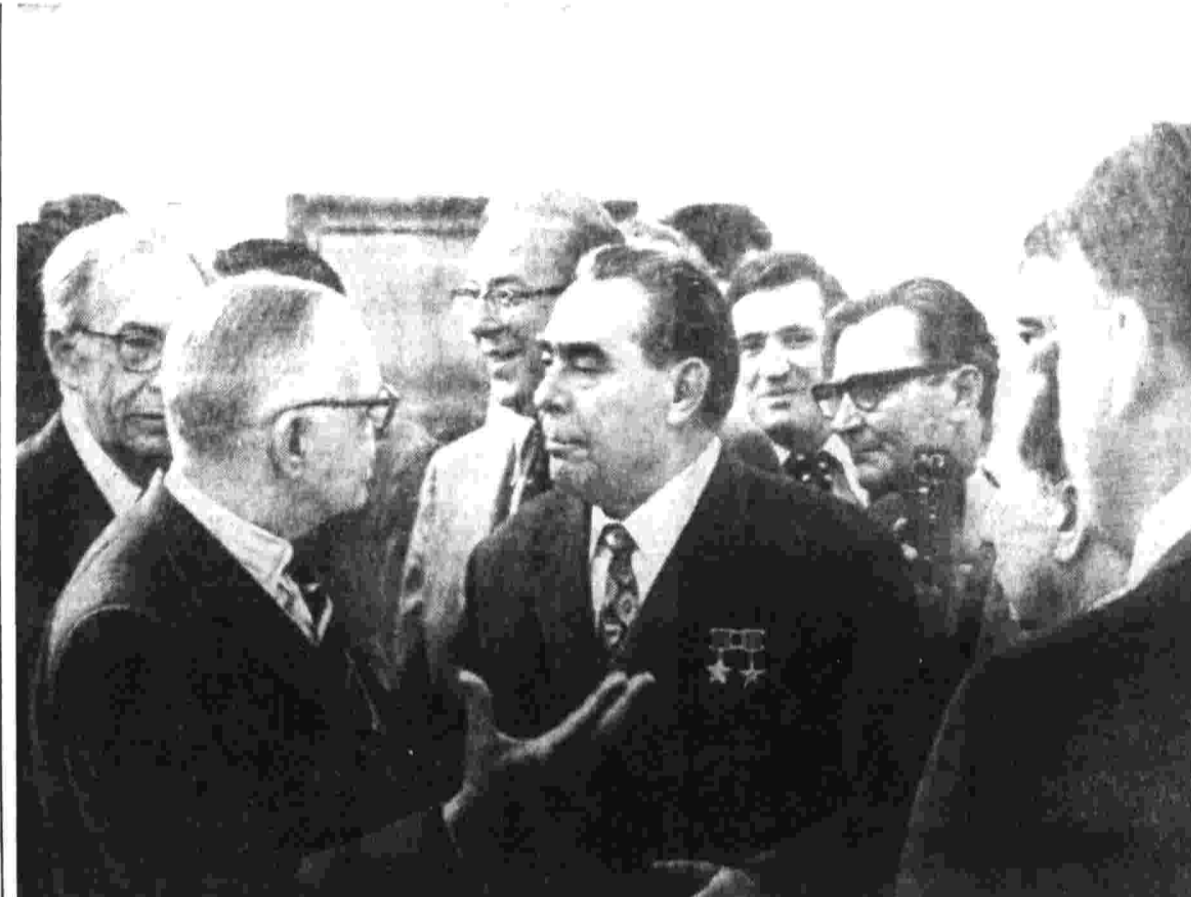
Встреча Л. И. Брежнева с представителями деловых кругов США.

ВАШИНГТОН, 23. (ТАСС). Вчера в посольстве СССР в США состоялась встреча Генерального секретаря ЦК КПСС Л. И. Брежнева с представителями руководства Коммунистической партии США — Национальным председателем Компартии США Генри Уинстоном и Генеральным секретарем Компартии США Гасом Холлом. Встреча прошла в сердечной и братской атмосфере. В ходе беседы руководители Коммунистической партии США высоко оценили значение официального визита Л. И. Брежнева в США для обеспечения коренного поворота в советско-американских отношениях и дальнейшего общего оздоровления международной обстановки в целом. Они подчеркнули, что визит является свидетельством новых побед политики мирного сосуществования, что он открывает новые