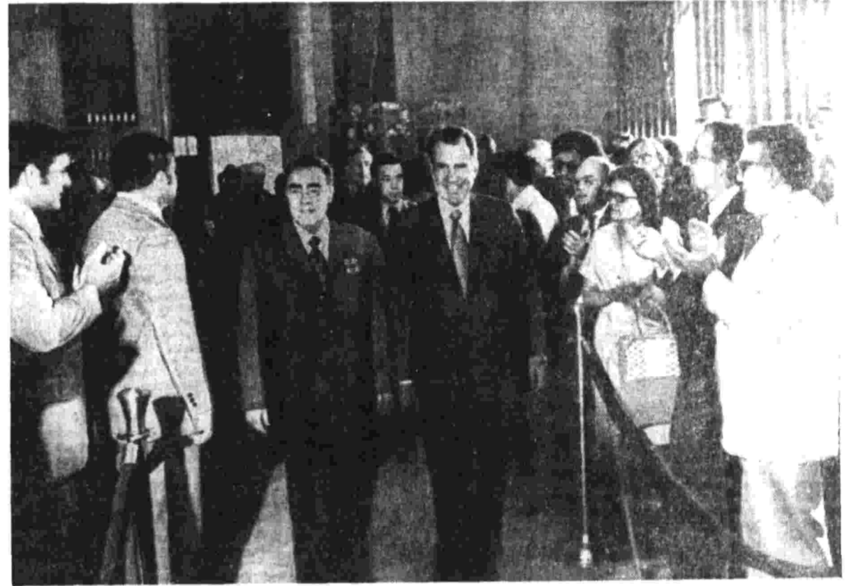
Вашингтон, 19 июня 1973 года. Присутствующие в зале Франклина приветствуют Л. И. Брежнева и Р. Никсона. Слева — Л. И. Брежнев, справа — Р. Никсон.

В зале находилась большая группа советских, американских и иностранных журналистов.