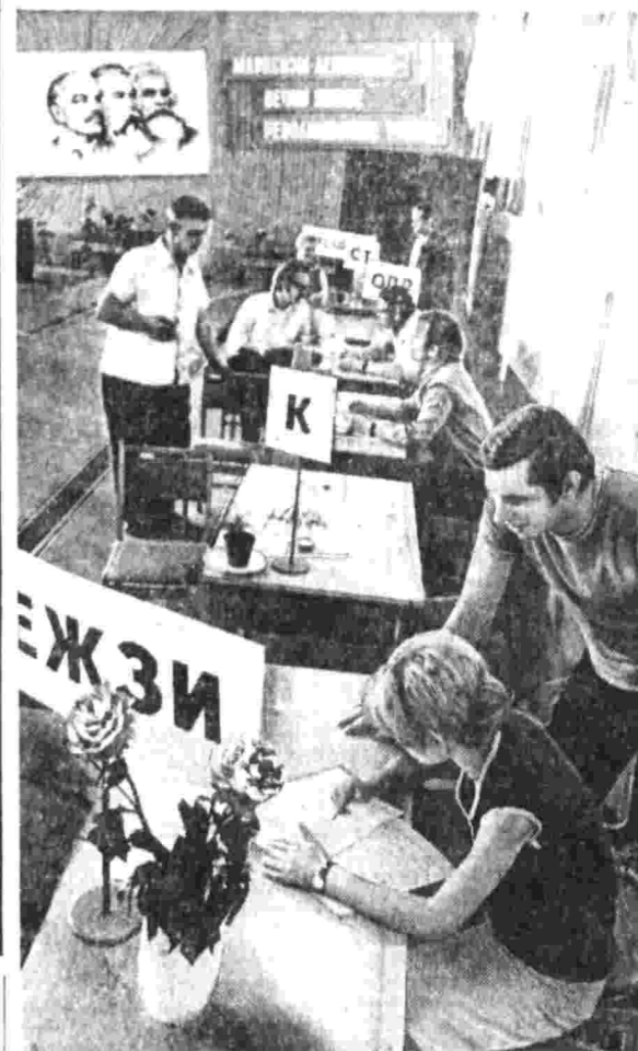
Хорошо провели подготовку к выборам члены комиссии избирательного участка № 16 Кировского района города Москвы. Сегодня избиратели приходят в уютное, красочно оформленное помещение для голосования.

Большой и волнующий день сегодня у народов нашей страны. Ранним утром во всех республиках гостеприимно открылись двери избирательных участков, начались выборы в краевые, областные, окружные, городские, районные, сельские и поселковые Советы депутатов трудящихся. Миллионы и миллионы советских людей дружно голосуют за кандидатов нерушимого блока коммунистов и беспартийных.