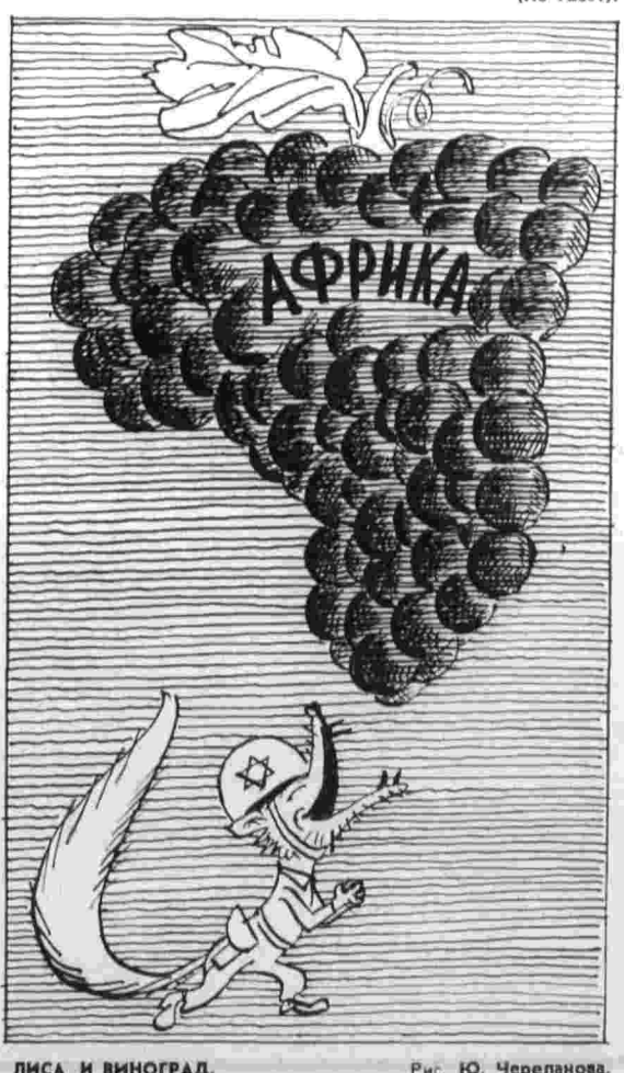
ЛИСА И ВИНОГРАД. Рис. Ю. Черепанова.