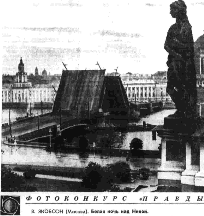
ФОТОКОНКУРС «ПРАВДЫ» В. ЯКОБСОН (Москва). Белая ночь над Невой.

Что значит в наше время быть патристом и интернационалистом на деле?