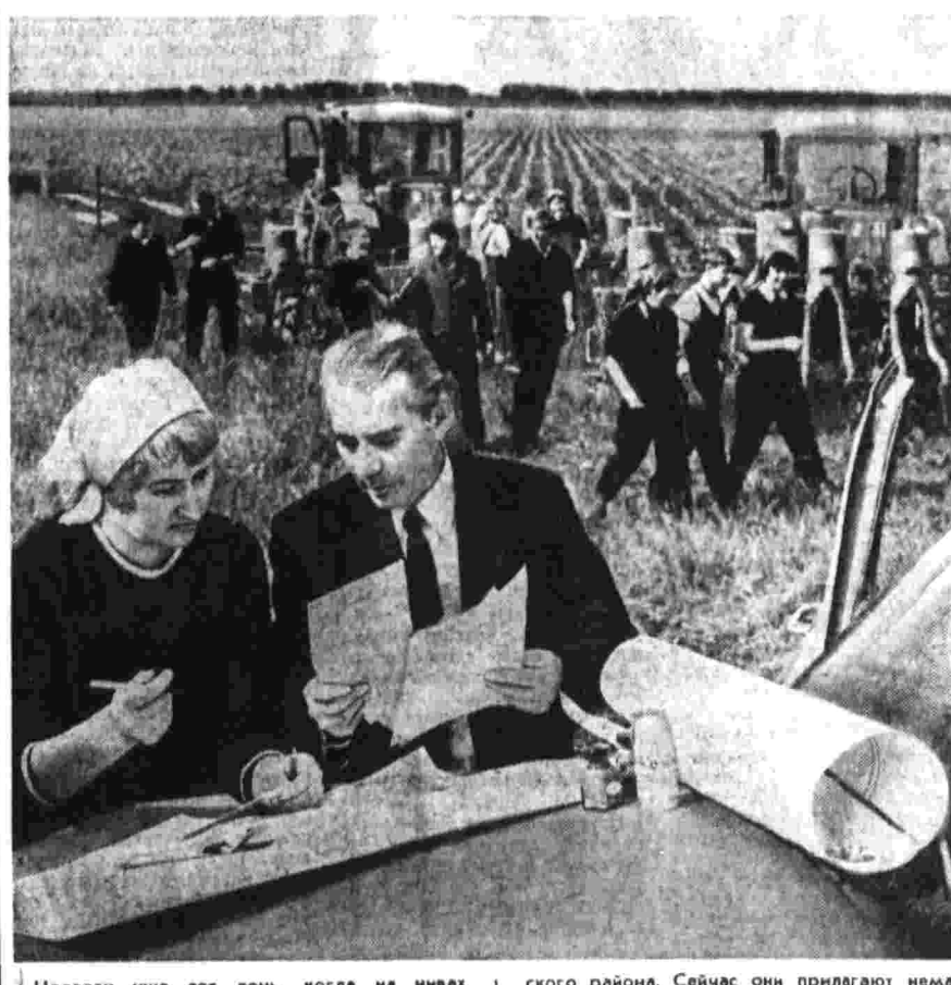
Недалек уже тот день, когда на нивах Краснодарского края наступит урочный час жатвы. А пока земледельцы Кубани организованно готовят к ней уборочную технику, намечают рабочие планы страды.

НОВАЯ АМУДАРЬ. Не раз она выходила из своих берегов, многократно меняла русло. Чтобы уберечь г. Туркунду и селения Бирунийского района от наводнения, строители треста «Каракалпакводстрой» соорудили новое русло реки. Сейчас работает на стройке коллектив экскаватора ДЭР-16 под руководством баггермейстера Д. Джанабергенова. Ежедневно экипаж вынимает по 250 кубометров грунта.