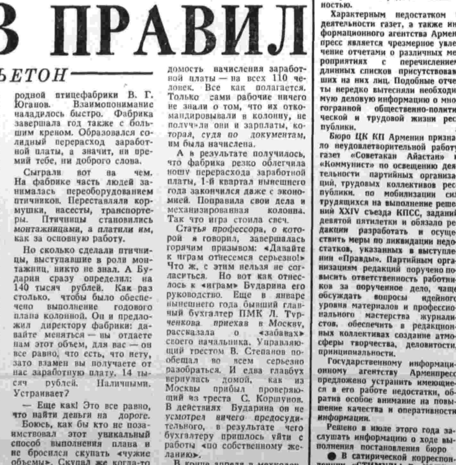
Г. ИВАНОВ. Волгоградская обл.