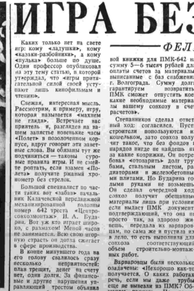
В. ЯКОБSON.