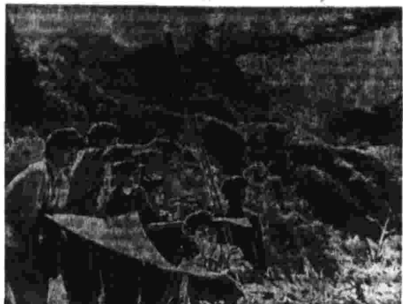
ИОНДР. С наступлением полевых сезонов геологи республики отправлены в труднодоступные горные районы на разведку природных богатств. На снимке: отряд геологов в горах.

ВАРШАВА, 5. (Соб. корр. «Правды») За пять лет назад на экономической карте народной Польши появилось новое предприятие — Олаштынский шинный комбинат. В его цехах более половины оборудования — с маркой советских заводов.