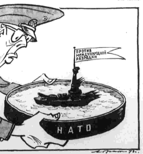
ПО НАТОВСКОМУ КОМПАСУ.

Вопрос заключается в том, что бат как национальная валюта слишком тесно привязана к американскому доллару, неустойчивость которого сразу отражается на внутреннем экономическом положении Таиланда. Девальвация доллара, заявляет правительство, не поведет за собой девальвацию бата. Действительно, соотношение валют было объявлено неизменным. Но это как раз и привело к быстрому росту цен, особенно на иностранные товары. Таиланд ввозит из-за границы промышленные изделия — от текстиля до керосиновых ламп, а вывозит рис, древесину, каучук, продукты горючего отрасли. Правительство намеревалось создать благоприятные условия для увеличения экспорта и сокращения импорта, чтобы улучшить внешнеторговые показатели. Однако его планам не суждено было сбыться. Девальвация