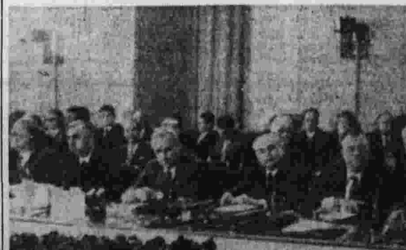
Прага, 5 июня 1973 года. XXVII сессия Совета Экономической Взаимопомощи. На снимке: Председатель правительства ЧССР Л. Штругал открывает сессию.

Содоклад Комитета СЭВ по сотрудничеству в области плановой деятельности сделал председатель комитета — заместитель Председателя правительства ЧССР, председатель государственной плановой комиссии В. Гула.