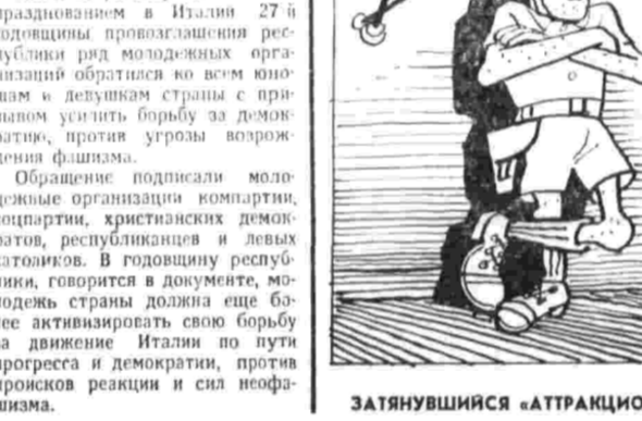
Рис. Ю. Черепанова.