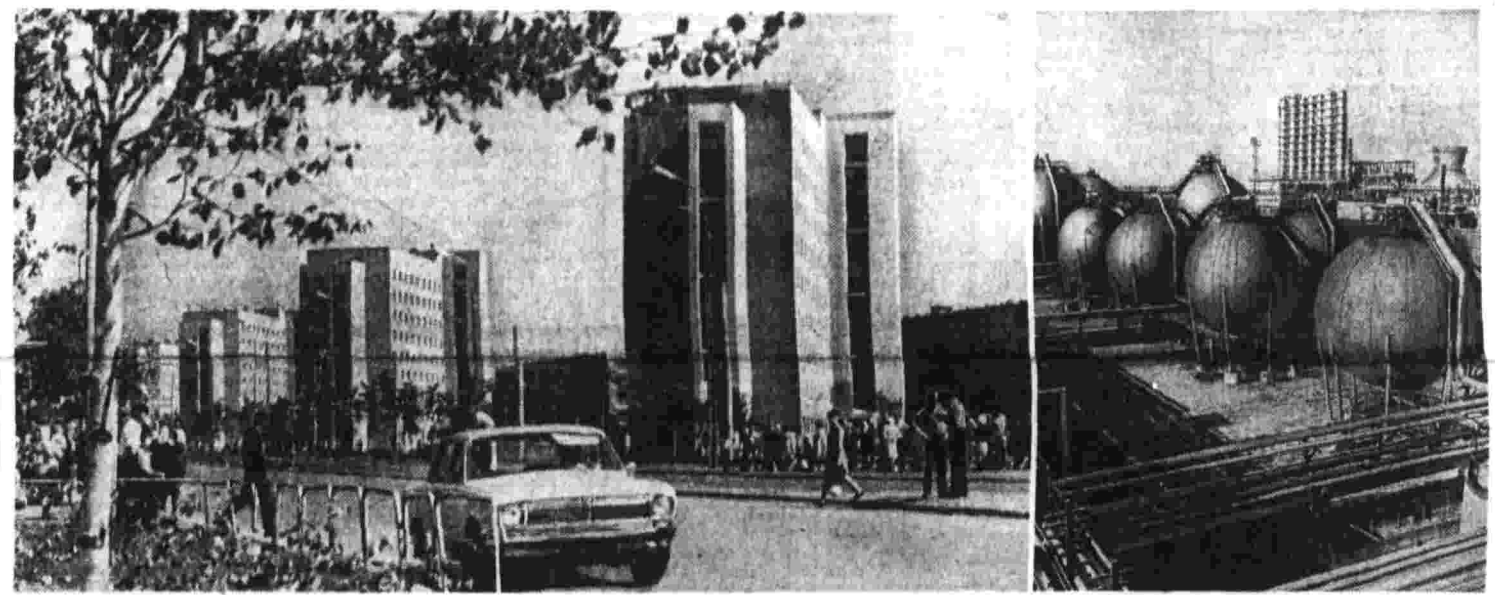
Панорама молодых городов НИЖНЕКАМСК

НИЖНИЙ ТАГИЛ (Свердловская обл.), 2. (Корр. «Правды» В. Данилов). Девять моделей одежды, вышедшей из Никитинской швейной фабрики, привнес государственный Знак качества. Коллектив предприятия ставит задачей резко увеличить производство изделий, пользующихся повышенным спросом. Пятидесятый план реализации продукции перевыполнен, первые две июня показатели, что и шестимесячное задание удалось значительно перевыполнить. В соревновании бригад, участков, цехов особое внимание уделяется сейчас качественному показателю.