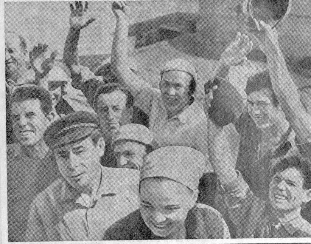
Ю. МУКИМОВ. (Корр. «Правды».) Узбекская ССР.

САНТЬЯГО, 1. (ТАСС). Сюда по приглашению президента Чили Сальвадора Альенде с официальным визитом вчера прибыл президент Кубы Освальдо Дортинес. В международном аэропорту «Пулауэль» высокого гостя и сопровождающих его лиц тепло встретили Сальвадор Альенде, министры правительства Народной единства.