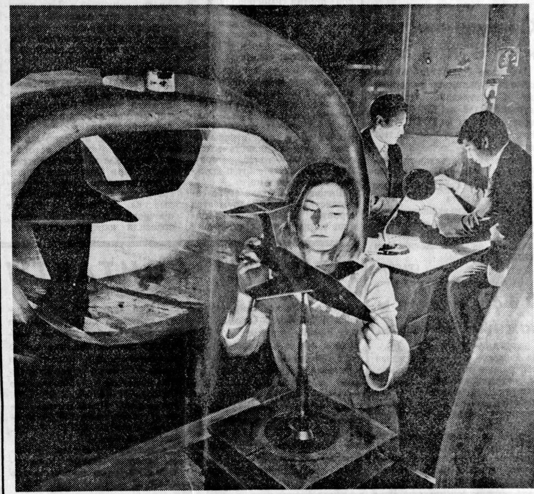
«Мы тоже учим летать самолеты!» — уверено, так будут со временем говорить о своей работе выпускники Ленинградского института авиационного приборостроения.

заяв, кто взрывается и что взрывается, казалось бы, вполне самобытный внутренний мир молодых героев первой повести.