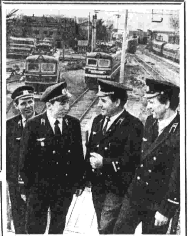
Среди тех, кого выдвинули москвичи кандидатами в депутаты местных Советов...

Газета основана 5 мая 1912 года В. И. ЛЕНИНЫМ Орган Центрального Комитета КПСС № 151 (20025) Четверг, 31 мая 1973 г. Цена 3 коп.