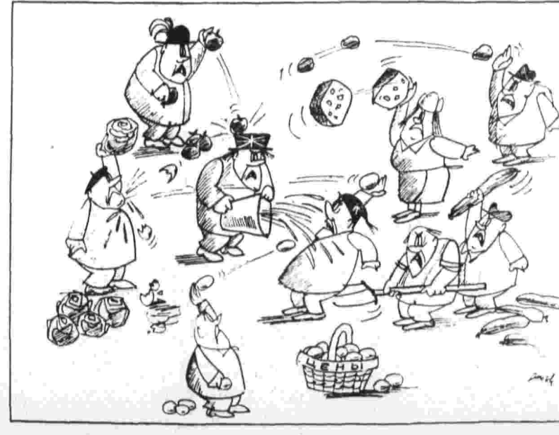
РЫНОЧНАЯ СЦЕНКА. Рис. из газеты «Хандельсблот» (ФРГ).