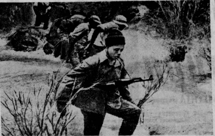
ДАР-эс-САЛАМ, 29. (ТАСС). Африканские патриоты, ведущие вооруженную борьбу против португальских колонизаторов в Мозамбике, продолжают успешные боевые действия в провинции Манабу-Делгаду...