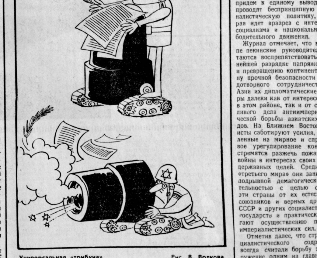
Универсальная трибуна. Рис. В. Волкова.

Тель-Авив продолжает саботировать усилия, направленные на достижение политического урегулирования ближневосточного кризиса. Либерально-зависимые от США и Израиля экстремисты наращивают вооружения. (Из газет).