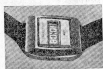
Есть какое-то величие в парадигме большой интегральной схемы, разрабатываемой в поле зрения микроскопа. Слово зримый с птичьего полета проливает некий город, замурованный в кристалле, как мушка в янтаре. Вы любуетесь экономной плотностью его застройки, хитроумным лаконизмом его компоновки, покоряющим ритмом его архитектурного плана, за которым угадывается целесообразность. Еще миг, и в ушах зазвучит торжественная музыка, иллюстрирующая кинопаранами, которые захватывают дух. Кто же дивный зодчий, начертанный этот сложный план, где так мудро сплелись более тысячи радиоэлектронных элементов? Или ему — ЭВМ! Это она, проведя мигриды вычислений, примиряя и сива сотни противоречий, отыскала оптимальный порядок и сама нарисовала план. Приятно знать, что часы третьего тысячелетия на девятитомном автоматическом спроектированы автоматическим ИТЭМ, на языке электронного переводчика, подающего монотонные импульсы, поступающие от счетчика, а на выходе рождаются сигналы, управляющие цифровым табло. Общий принцип цифрового табло восходит к геометрической идее, сохранившейся в заметках великого поэта А. С. Пушкина, озаглавленной «Таблица». «Форма цифров арабских» — замечает автор, — составлена из следующей фигуры и рисует остроумную фигуру, куда, действительно, вписываются все цифровые анаки. Если выделить те или иные штрихи универсальной фигуры, то является любая из цифр. Ничего это умест делая каждый, вода первым по фигурным трафаретам почтовых индексов на конвертах. А на спортивных табло цифровые штрихи высвечиваются электричеством.

Многие миллионы часов! Именно поэтому часы третьего тысячелетия оказались без стрелок. Были найдены чисто электронные методы перевода монотонного, как капля, языка электрических импульсов на язык подвижных и зримых цифровых знаков. Электронным переводчиком служит важная часть интегральной схемы, чем схема счетчика, по той уважительной причине, что профессия переводчика сложнее, чем профессия счетовода.