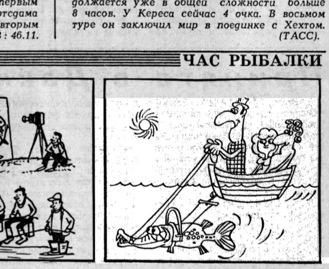
В одну рыбку сыт... Рис. В. Володина и Д. Гаева.