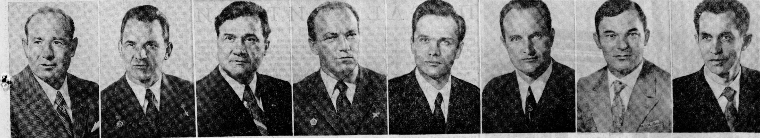
А. А. Леонов, В. Н. Кубасов, А. В. Филиппенко, Н. Н. Рукавишников, В. А. Джанибеков, Б. Д. Андреев, Ю. В. Романенко, А. С. Иванченков. ПЕРВЫЙ ЭКИПАЖ. ВТОРОЙ ЭКИПАЖ. ТРЕТИЙ ЭКИПАЖ. ЧЕТВЕРТЫЙ ЭКИПАЖ.

им предстоит длительные интенсивные тренировки. Как уже сообщалось, Академией наук СССР утверждены экипажи советских космонавтов на основную и резервный корабли «Союз». Сегодня мы публикуем фотографии советской космической «дружины», которая готовится к историческому полету.