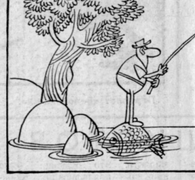
— Говорят, здесь водятся большие караси...