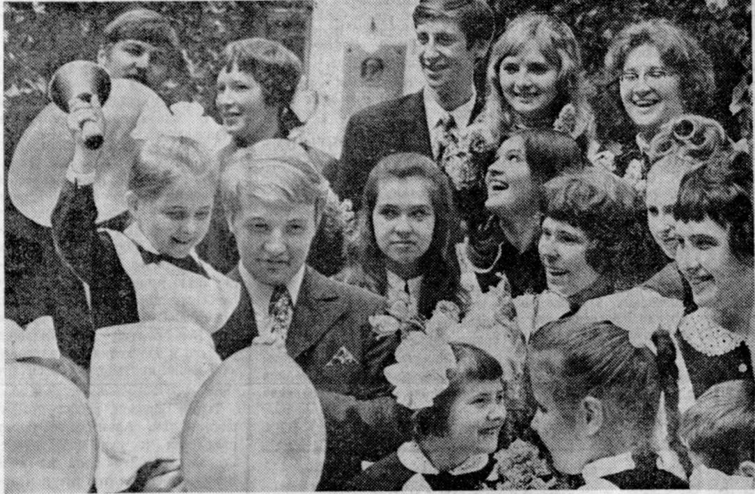
Вчера пришла как последнее звонка для выпускников школ страны. Многие слышали в его мелодию юности и девушки, которые, сдав выпускные экзамены, вступают на большую дорогу жизни...