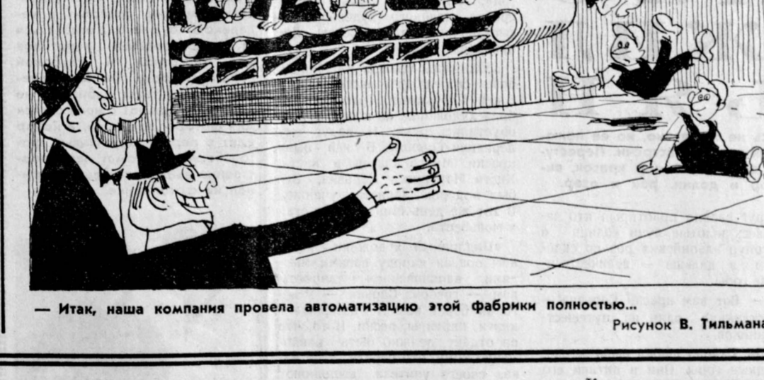
Итак, наша компания провела автоматизацию этой фабрики полностью... Рисован В. Тильманом.

В связи с автоматизацией в западных странах продолжает расти безработица. (Из газет).