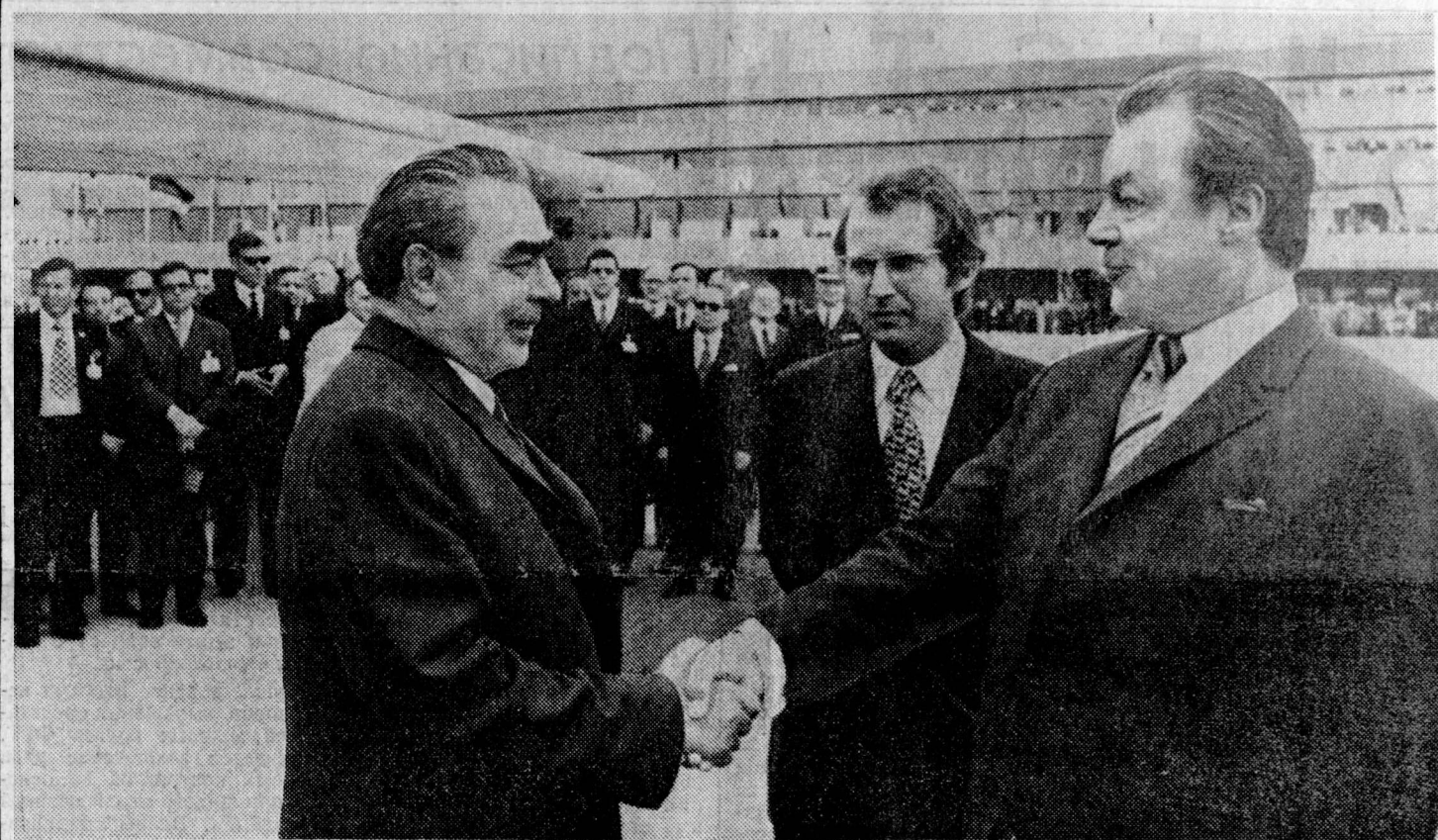
Проводы на аэродроме Кёльн-Бонн.