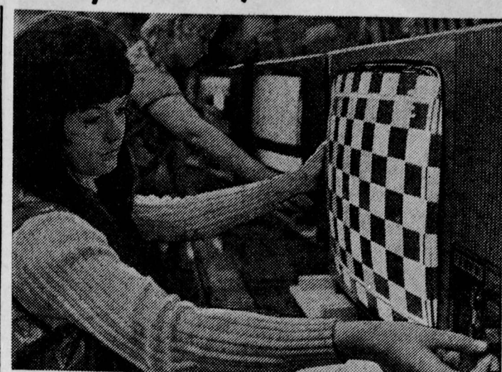
ГДР. Серийное производство новых телевизоров «Люксомат» начато на заводе в Стаффурте. Удостоенный золотой медали на прошлогодней осенней международной выставке в Лейпциге, этот аппарат по сравнению с другими моделями потребляет меньше электроэнергии, в его конструкции широко использованы полупроводники.

СОФИЯ, 22. (Соб. корр. «Правды»). Активную подготовку к летнему полевому сезону развернули работники водно-мелиоративных хозяйств Болгарии. В стране орошается 1,063 тысячи гектаров, а в хозяйствах орошаемой земли — каждый пятый гектар. Это позволяет орошать поля и госхозам получать высокие и устойчивые урожаи сельскохозяйственных культур.