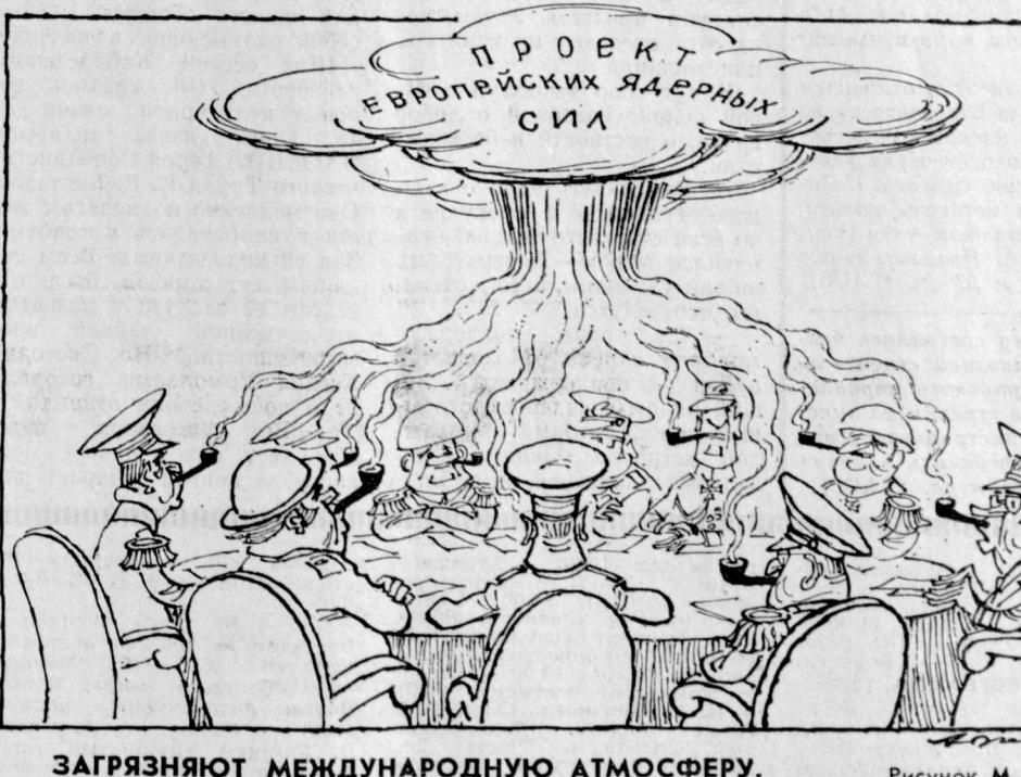
ЗАГРЯЗНЯЮТ МЕЖДУНАРОДНУЮ АТМОСФЕРУ. Рисунок М. Абрамова.

Как показали итоги недавней сессии группы ядерного планирования НАТО, определяющей атлантический континент, требуют наращивания ядерной мощи стран членов блока.