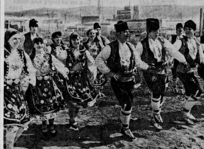
Молодежь Народной Республики Болгарии активно готовится к XX Всемирному фестивалю молодежи и студентов в Берлине. На снимке вверху — танцевальный ансамбль строителей Девятого промышленного комплекса, получивший путевку в Берлин.

УЛАН-БАТОР, 21. (Соб. корр. «Правды»). «Все на выборы» — этот лозунг можно встретить в цехах промышленных предприятий, на улицах городов и поселков, в зданиях современных столичных. Страна готовится в июне избрать новый состав высшего органа страны — Великого Народного хурала. Сколоводы, рабочие и служащие стали на предвыборную трудовую вахту. Открыты агитпулты — их в столице 120. Началось выдвижение кандидатов в депутаты. В. ШАРОВ.