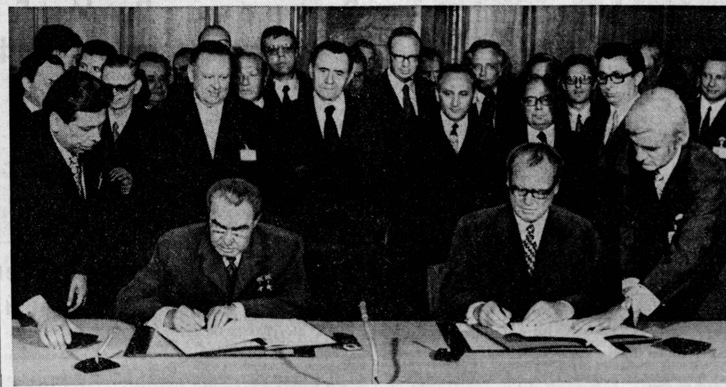
Подписание совместного заявления.

БОНН, 21. (Спец. корр. ТАСС). Генеральный секретарь ЦК КПСС, член Президиума Верховного Совета СССР Л. И. Брежнев дал сегодня обед в честь федерального канцлера ФРГ В. Брандта. На обеде были сопровождающие Л. И. Брежнева советские официальные лица, члены делегации, принимающие участие в Днях Советского Союза в Дортмунде. Со стороны ФРГ были члены федерального правительства, премьер-министры ряда земель, депутаты бундстага и бундсрата, деятели культуры, руководители общества «ФРГ — СССР», другие официальные лица. Генеральный секретарь ЦК КПСС Л. И. Брежнев выступил на обеде с речью.