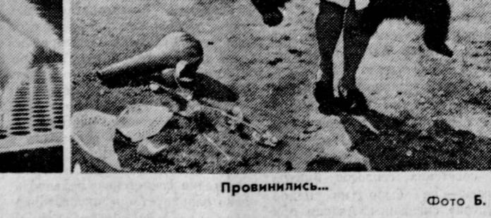
Провинились... «Интересно, что на обороте!».