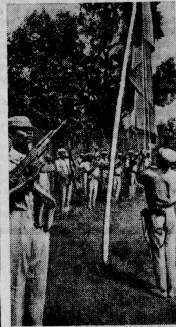
Народы Анголы, Мозамбика и Гвиней (Бисау) ведут вооруженную борьбу против португальских колонизаторов за независимость своей родины.