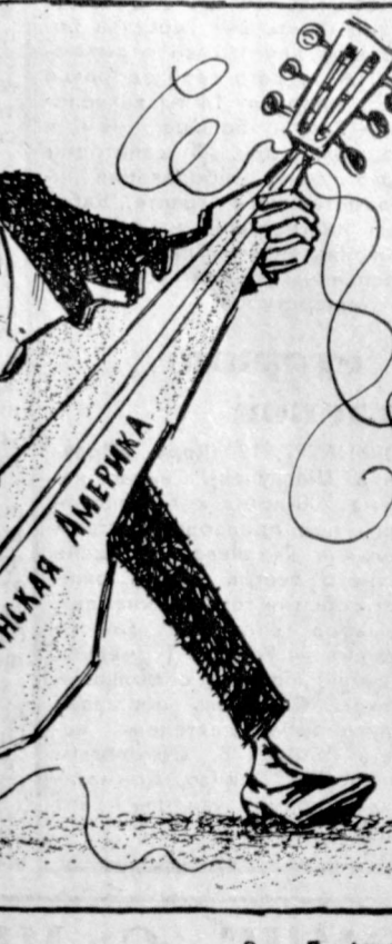
Расстрелялся... Рис. Д. Гагаев.