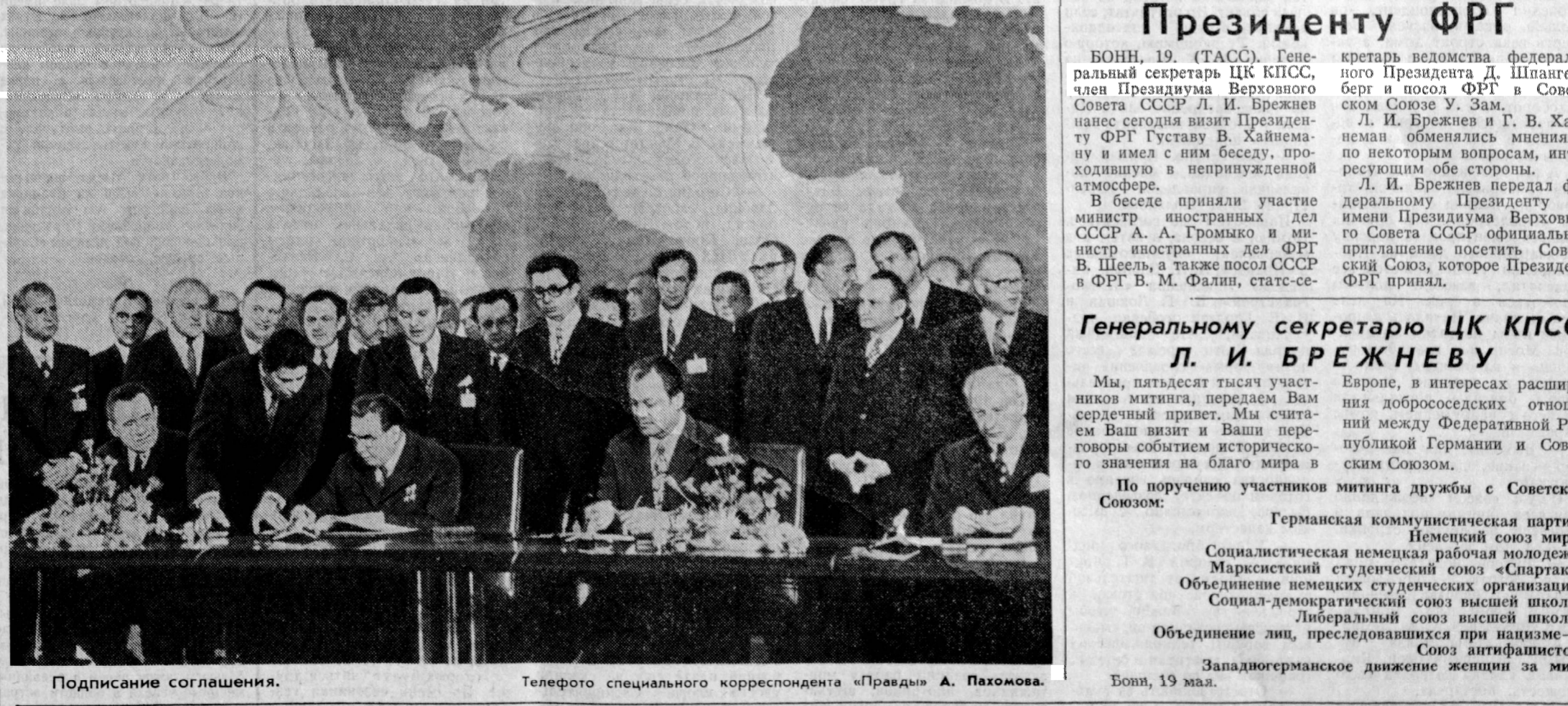
Подписание соглашения.