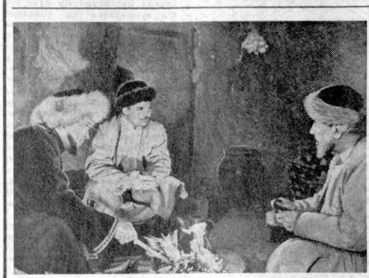
«Скрипчик от алтаря» — так называется художественный фильм, который создадут кинематографисты Узбекистана по одноименному роману Абдуллы Кадыри. Эту ленту снимает творческая группа во главе с режиссером Микеланджело...

КИРОВАБАД, 13. (Спец. корр. «Правды» М. Капустин). Вот уже третий год хозяйкой Кировабада в один из дней мая становится песня. Она развешивается на улицах флагами и броскими транспарантами, озвучивается музыкальных оркестров площадями, ставит на дома, троллейбусы, автомашины свой личный знак — скрипящий ключ.