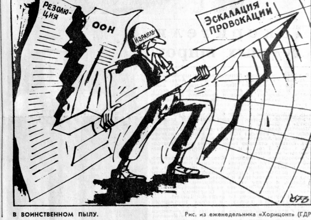
В ВОИНСТВЕННОМ ПЫЛУ. Рис. из еженедельника «Хоризонт» (ГДР).

Несмотря на осуждение его политики Организацией Объединенных Наций, Тель-Авив продолжает провокации в отношении арабских стран. (Из газет.)