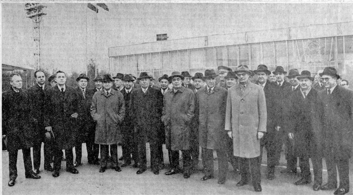
Москва. Проводы на Внуковском аэродроме.

На Внуковском аэродроме, украшенном государственными флагами СССР, товарища Л. И. Брежнева провожали