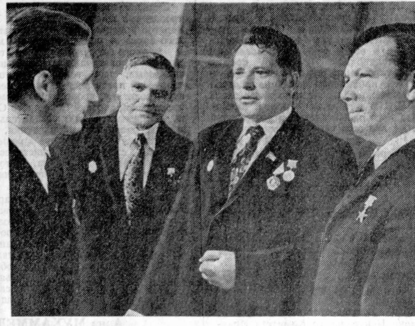
Каковы же первые итоги практического применения новых принципов организации соревнования? Коллектив завода выполнил план четырех месяцев по всем технико-экономическим показателям. Реализовано сверхплановой продукции на несколько миллионов рублей.

Слово металлургов не раскочерит с делом. Четырехмесячный план бригады выполнен с опережением. По плану плана около восьмидесяти тонн стали, сэкономлено много электроэнергии и различных дорогостоящих материалов — компонентов плавки. Этих ресурсов достаточно для работы в течение целой рабочей смены.