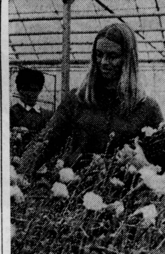
БОЛГАРИЯ. В оранжереях объединения «Булгарцвет» в Беллинграде выращивают миллионы гвоздик.

БЕРЛИН, 10. (Соб. корр. «Правды»). Воле Ростока на берегу морского залива выдвигается лес гигантских подмываемых и корабельных брантов. В крупнейшем морском порту Германской Демократической Республики работы не затихают ни днем ни ночью. Непрерывным потоком идут через порт грузы для народного хозяйства ГДР, товары, которые ГДР отправляет на экспорт. Только в первом квартале нынешнего года в порт побывало около 900 кораблей. Постоянно возрастает роль Ростоцкого порта в транзите грузов, предназначенных для