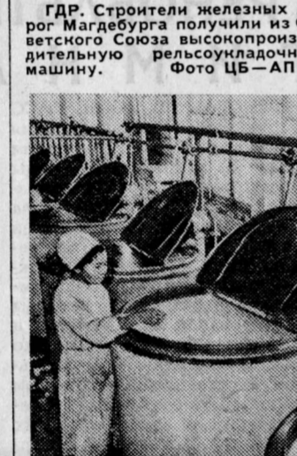
МОНГОЛИЯ. Хорошо известная жителям Улан-Батора продукция молочного завода, работающего при высоком уровне механизации. На снимке — в одном из заводских цехов.

ГАВАНА, 10. (Соб. корр. «Правды»). Все больший размах получают на Кубе социалистические соревнования. Соревнуются бригады, смены, предприятия. На днях были подведены итоги в соревнованиях предприятий базовой промышленности, в которую включаются металлургическая, металлообрабатывающая, машиностроительная отрасли. Только в провинции Гавана приняли участие в соревнованиях сто два предприятия. Повышение производительности труда, улучшение органи-