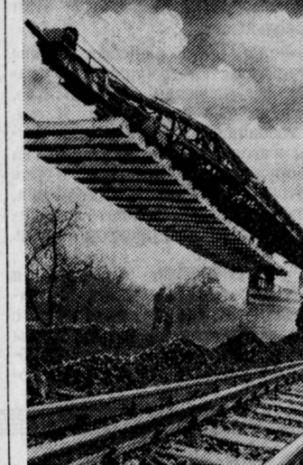
ГДР. Строители железной дороги Магдебурга получили из Советского Союза высокопроизводительную рельсоукладочную машину.

БУДАПЕШТ, 10. (Соб. корр. «Правды»). Большим успехом отмечена премьера спектакля «Процан, Гольсар» по повести лауреата Ленинской премии Чингиза Айтматова в будапештском театре «Микроскоп». Руководители театра Янош Комош заявил, что эта постановка продолжает собой целую серию спектаклей, посвященных жизни советского народа, над которой работает коллектив театра. В театре сложившиеся оперетты в эти дни показана премьера советской музыкальной комедии «Табачный капитан».