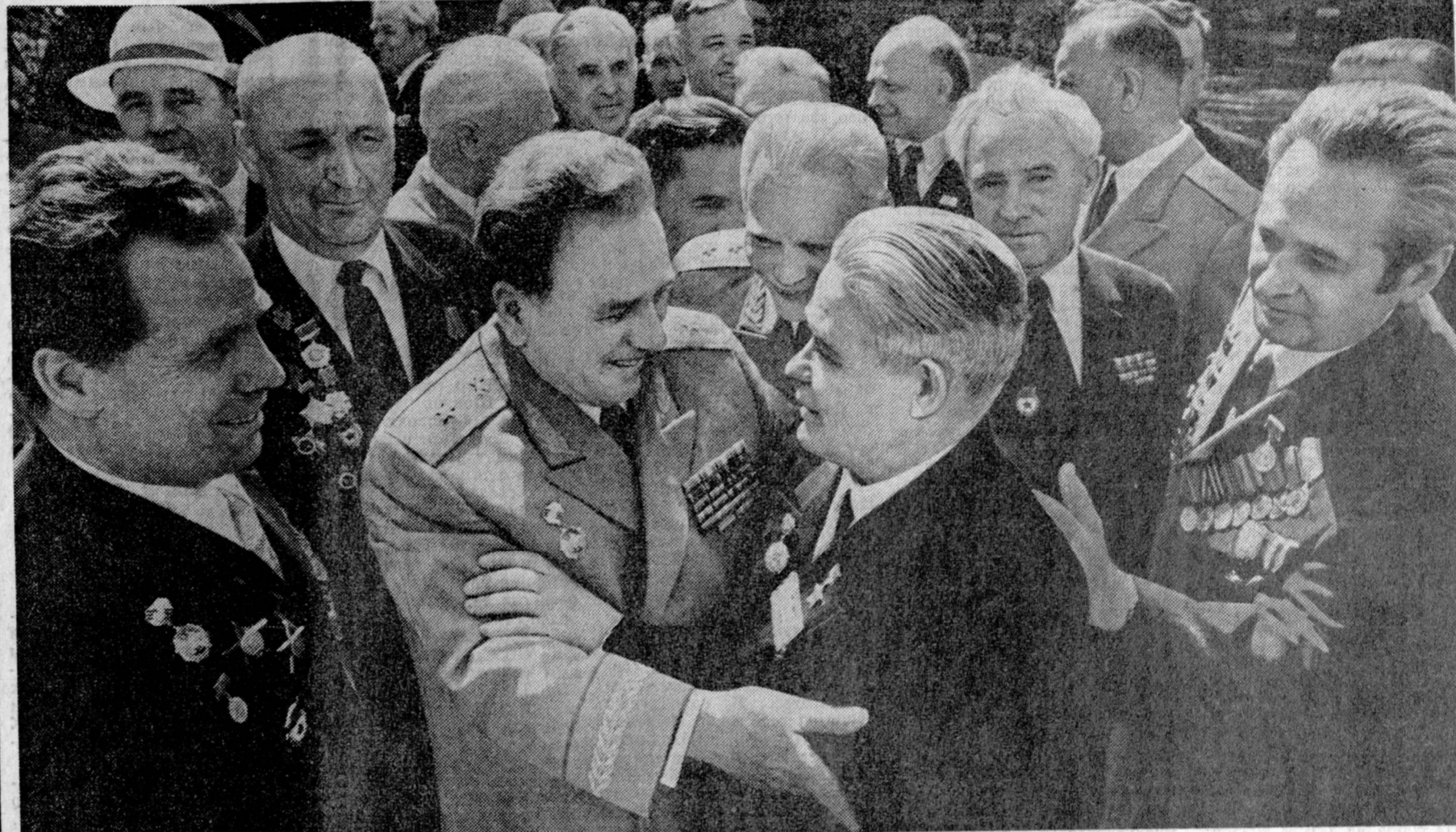
Страх и ужас наводили на врага гвардейские «Катюши» в годы Великой Отечественной войны. Летописцы нашей Победы. В камуфляжных частях съезжались со всех концов страны в Москву на свою традиционную встречу. Были и дружеские объятия, и смех, и улыбки, и жемчужная в память о павших в боях товарищах...