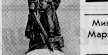
Министр обороны СССР Маршал Советского Союза А. ГРЕЧКО

В результате победы под Курком и на Северном Кавказе, а также выхода советских войск к Днепру завершился коренной перелом в ходе Великой Отечественной и второй мировой войны.