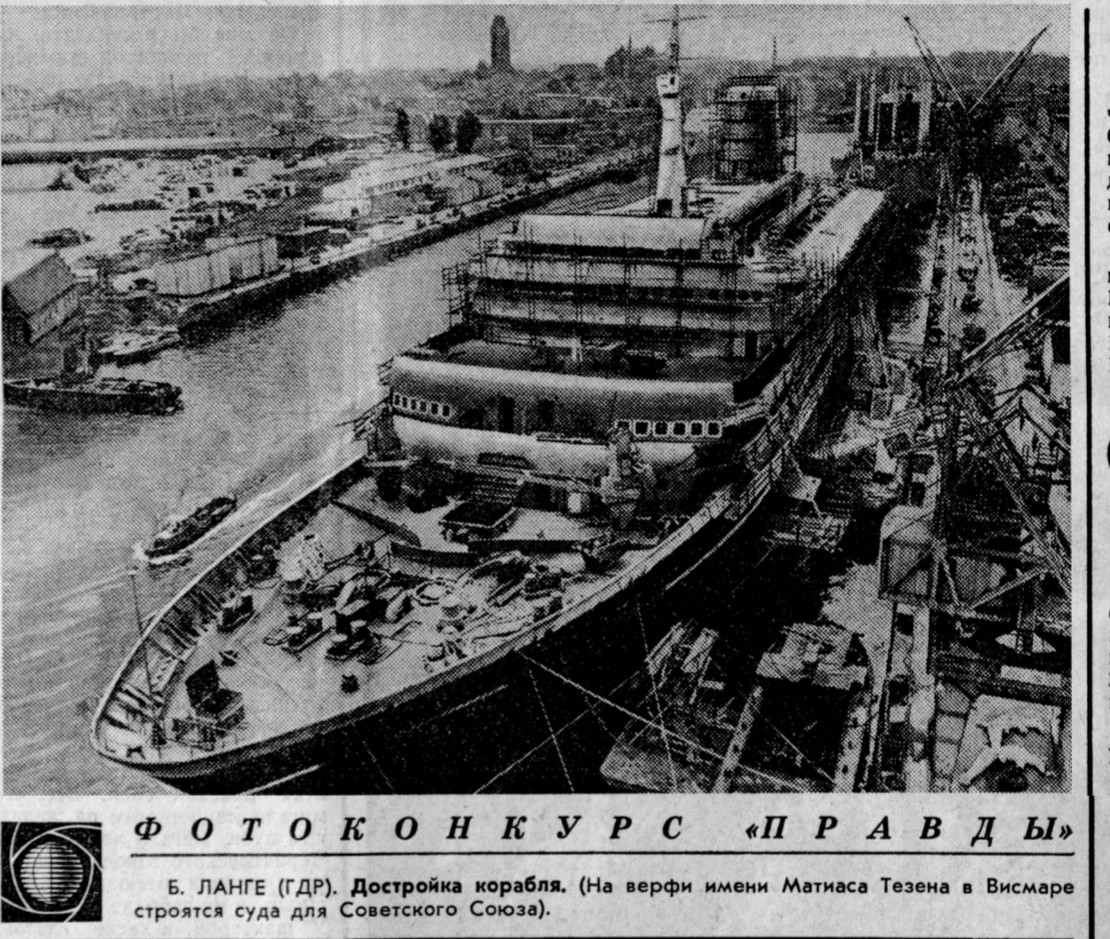
Достройка корабля. (На верфи имени Матиса Тезена в Виславе строится судно для Советского Союза).