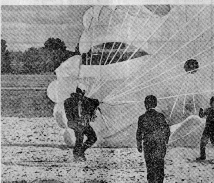
Фотоконкурс «Правды». А. ХРУПОВ (Москва), МОДИЦА. (Юные фотобиологи Горьковского Дома пионеров Московской области на практической съемке).