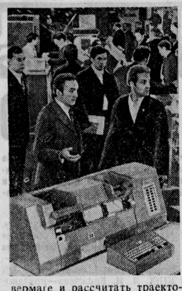
Вчера в ВДНХ состоялась пресс-конференция, посвященная выставке ЕС ЭВМ-73. А. КОРОВСКИЙ.

Эти машины обладают высокими характеристиками и надежностью, что позволяет им решать задачи широкого круга народнохозяйственных, инженерных и научных задач.