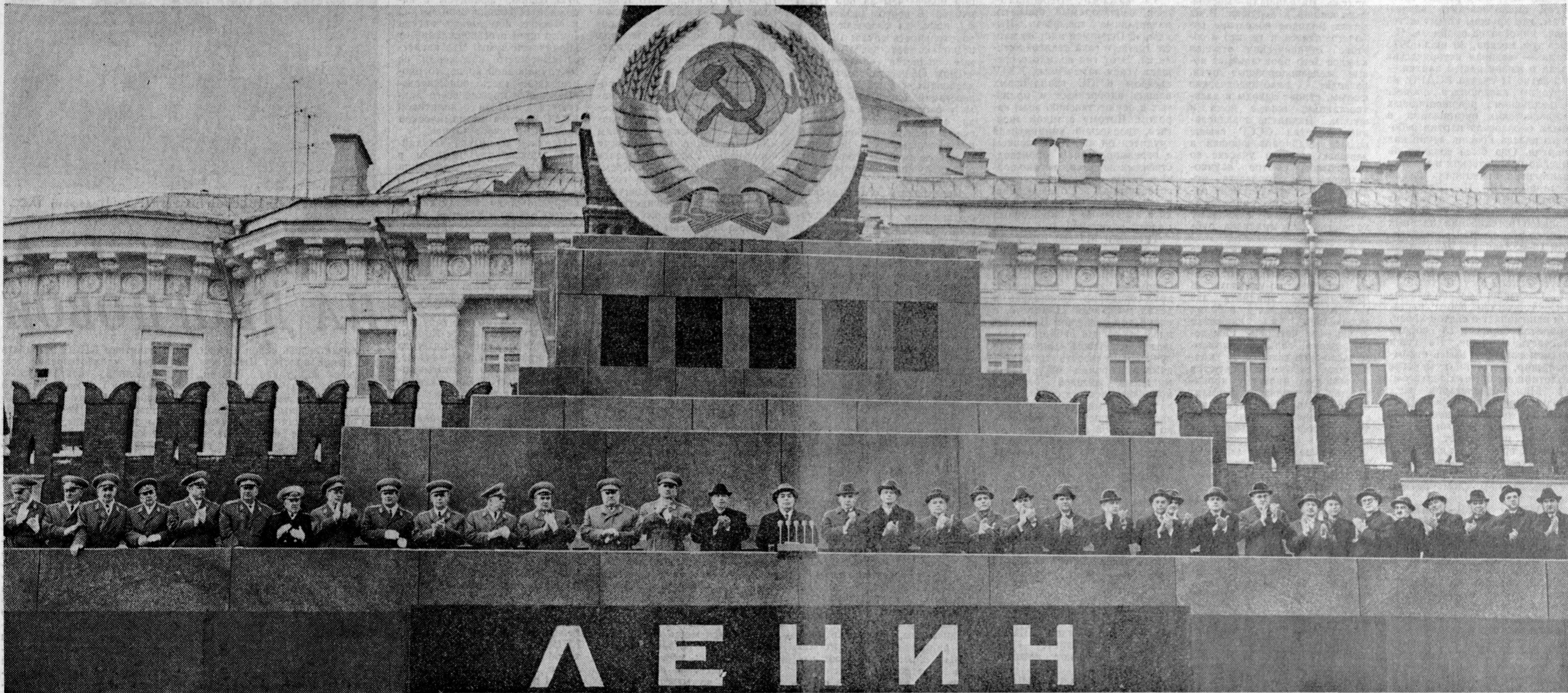
Москва, Красная площадь. 1 Мая 1973 г. На трибуне Мавзолея В. И. Ленина.

Первомай 1973 года прошел под знаком нерушимого единства Коммунистической партии и советского народа, успешного превращения в жизнь исторических решений XXIV съезда КПСС.