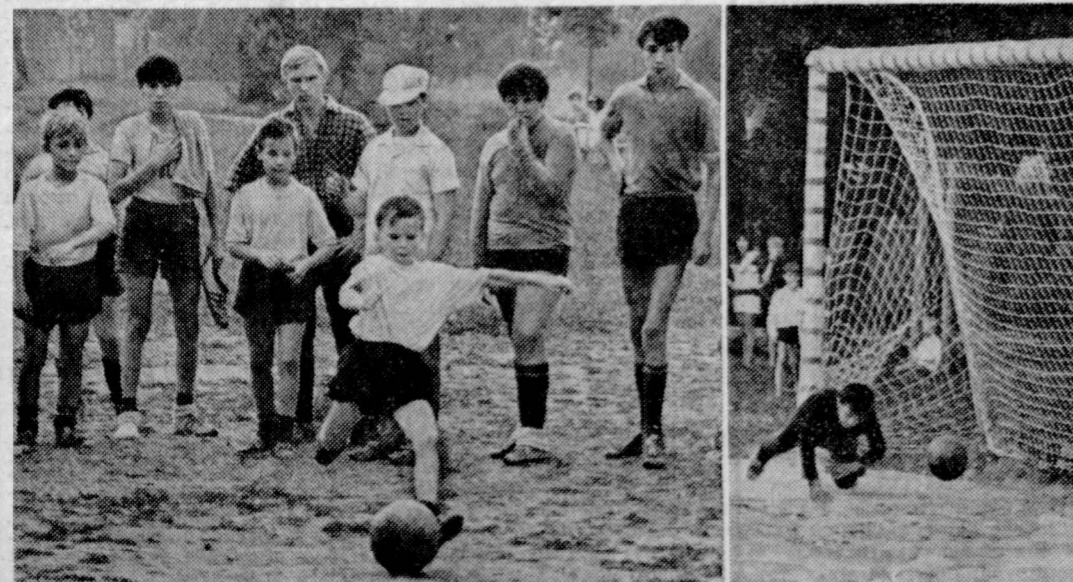
Играют мальчишки в футбол...

— Советская Россия открыла дорогу к светлой жизни, — горячо говорил он. — Дети наши готовятся стать борцами ленинской эпохи.