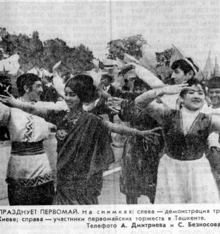
СТРАНА ПРАЗДНУЕТ ПЕРВОМАЙ. На снимках: слева — демонстрация трудящихся в Киеве; справа — участники первомайских торжеств в Ташкенте.