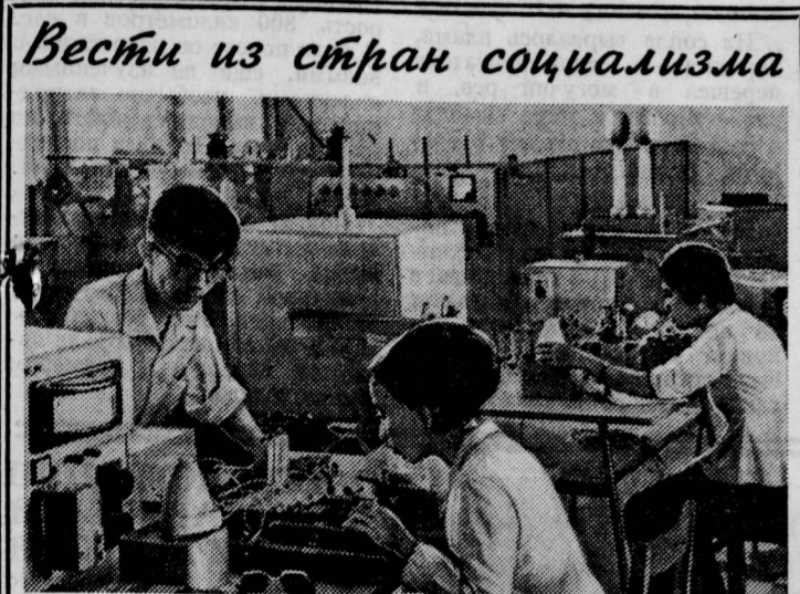
ДРВ. Большую помощь предприятиям республики оказывают студенты Ханойского политехнического института. Они непосредственно участвуют в производстве и помогают разрабатывать некоторые технические проекты.