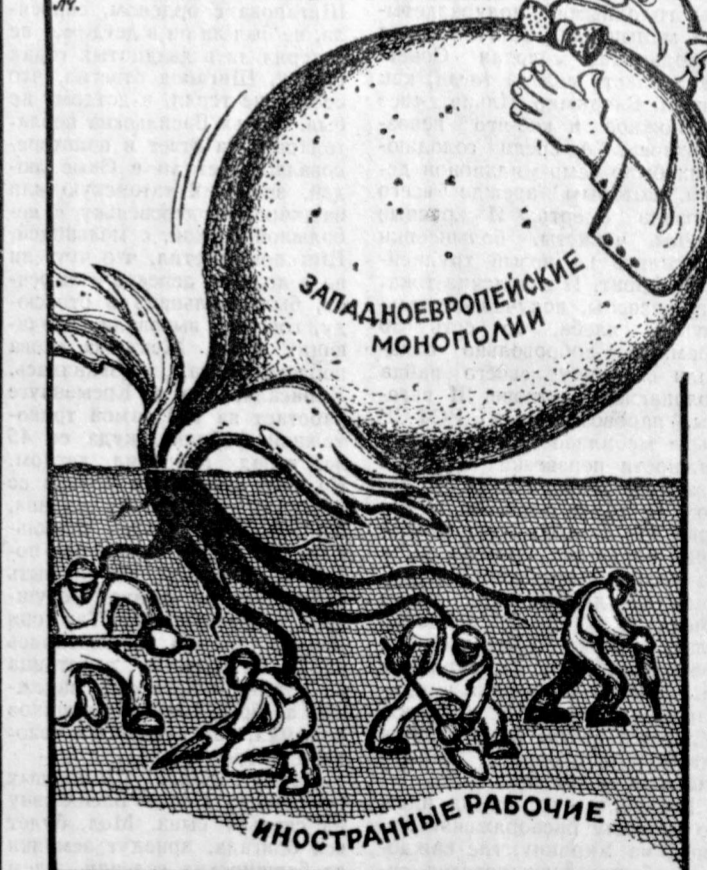
плод и его корни... Р. Л. Челупова.

Западные европейские монополии получают от эксплуатации рабочих-иммигрантов огромные прибыли. (Из газет).