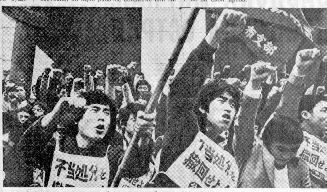
ЯПОНИЯ: демонстрация бастующих рабочих.

Правительство ДРВ постоянно поддерживает позицию патриотических сил Лаоса, выраженную в заявлении ЦК ПФЛ от 23 апреля 1973 года, справедливую борьбу лаосского народа за установление мира и осуществление национального согласия, подчеркивает в заявлении. В нем содержится также решительное осуждение действий США и вьетнамского правительства, грубо нарушающих соглашение о восстановлении мира и достижении национального согласия в Лаосе, и требование строгого соблюдения этого соглашения.