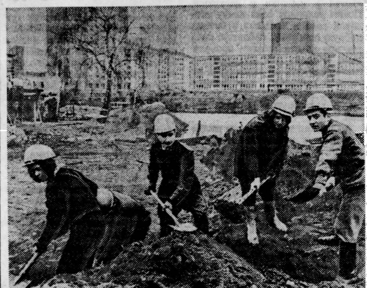
Юноши и девушки Германской Демократической Республики с энтузиазмом готовятся к X Всемирному фестивалю молодежи и студентов. Проходят субботники по благоустройству и озеленению столицы, строятся спортивные сооружения и другие фестивальные объекты. На снимке из: в работах по созданию «Острова дружбы» молодежи ГДР помогают гости — советские воины-командиры и молодые полки из Ополе. Здесь будут возведены выставочный павильон и кафе, лодочная станция и спортивные сооружения.

рей палестинских беженцев, расположенных в районе Сайды, сообщает Палестинское информационное агентство. Местная печать отмечает, что непрекращающиеся провокации Израиля против палестинских беженцев в районе Сайды указывают на то, что этот район может быть подвергнут новой широкой израильской агрессии. БЕЙРУТ, 25. (ТАСС). Израильские власти продолжают кампанию террора против арабских жителей на оккупированных территориях. По сообщению Палестинского информационного агентства, оккупационные власти арестовали в секторе Газа более 40 человек. Аресты проводятся также на оккупированном западном берегу реки Иордан.