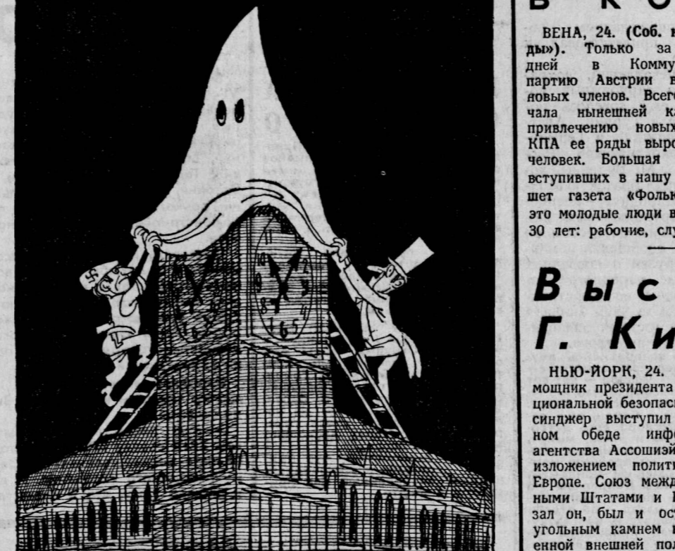
Расписный проект «реконструкции» английского парламента... Рис. Ю. Черепанова.

На днях член парламента Р. Белл потребовал прекратить въезд в Англию иммигрантов из тропических стран. С лозунгом «Сохраним Британию белой» выступают и правые экстремистские организации. (Из газет).