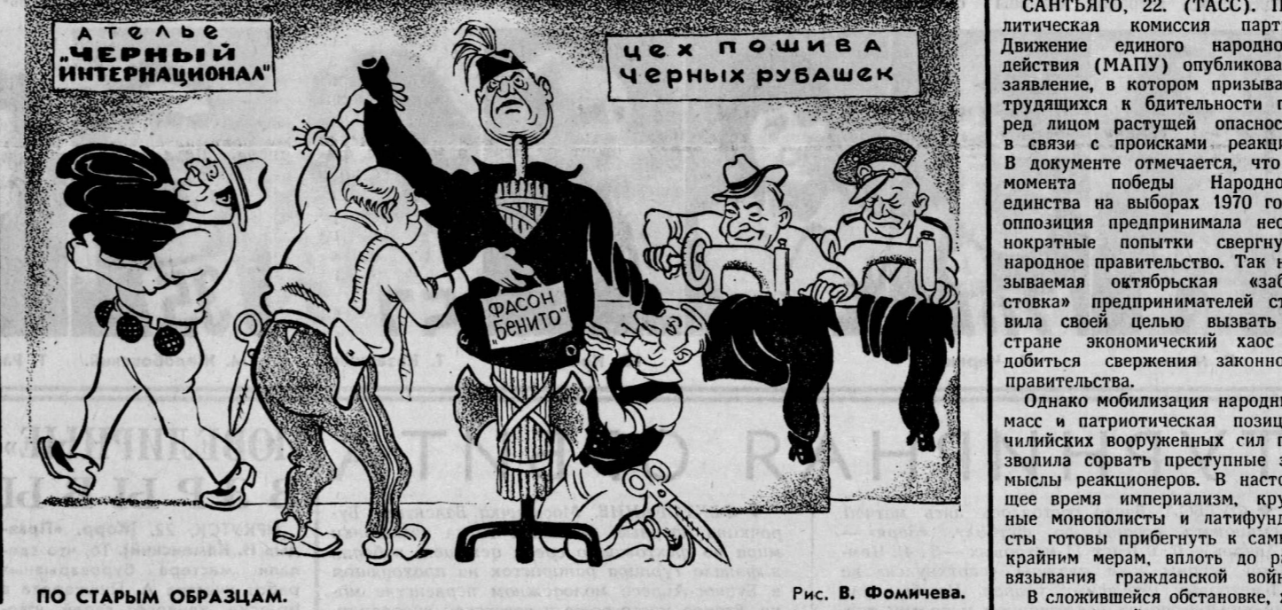
ПО СТАРЫМ ОБРАЗАМ. Рис. В. Фомичева.

Многие иностранные делегаты, находящиеся в Москве, изыскивая желание принять участие в этом добром деле, по оказанию материальной и моральной поддержки русскому народу. Иностранцы делегации приняли решение выйти на коммунистический субботник.