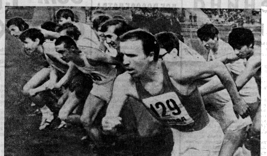
Один из забегов кросса.

После полудня стартовали спортсменки и спортсмены 19-29 лет, представляли юниоры.