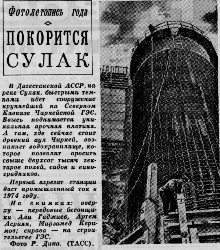
Фотолегион года Покорится Сулак. В Дагестанской АССР, на реке Сулак, быстрыми темпами идет сооружение крупнейшей на Северном Кавказе Чиркеевской ГЭС.