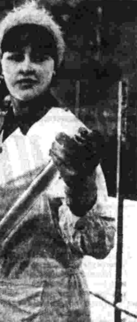
Фотосъемка работы бригады на строительстве.

Общая сила примера кое-где недооценивается. Подлинная гласность в соревновании подчас подразумевает пустой шумихой, конкретная организация дела — общими призывами, болтовней об опыте. В ряде случаев формально подводят итоги соревнований: называют передовиков, а «секреты» хорошей работы не раскрывают, и отстающие не могут ими воспользоваться. Такие факты имеют место, например, на Ждановском металлургическом, Минском инструментальном, Салаватском машиностроительном заводах, где рядом с трудовыми рекордами уживаются длительные отставания многих бригад и смен, плохо используются достижения как своих передовиков, так и коллективов, с которыми эти предприятия соревнуются.