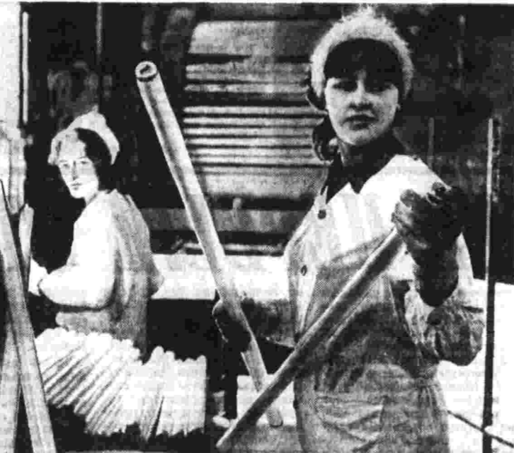
Фотосъемка работы бригады на строительстве.

◆ ЗА 35 РАБОЧИХ ДНЕЙ выполнили годовое задание трудники Темиртауского участка управления «Прокатмонтаж». Они со-