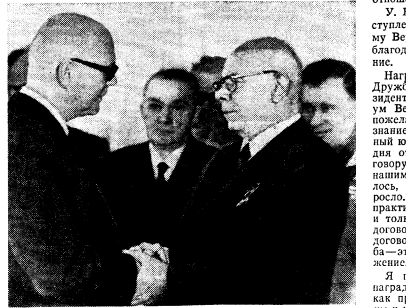
Председатель Президиума Верховного Совета СССР Н. В. Подгорный поздравляет У. К. Кекконена с наградой.

роლობных сил европейского континента. Н. В. Подгорный пожелал У. К. Кекконену новых успехов в плодотворной деятельности на благо финского народа и развития советско-финляндских дружественных отношений. У. К. Кекконен в своем выступлении выразил Президиуму Верховного Совета СССР благодарность за награждение. Награждая меня орденом Дружбы народов, сказал Президент Финляндии, Президиум Верховного Совета СССР пожелал выразить свое признание сотрудничества, важной копией которого мы сегодня отмечаем. Благодаря договору сотрудничества между нашими странами расширилось взаимопонимание и толкования договора. Наш договор — это действительно договор о дружбе, а дружба — это мир и взаимное уважение. Я принимаю эту высокую награду с удовольствием. Важной копией которого мы сегодня отмечаем. Благодаря договору сотрудничества между нашими странами расширилось взаимопонимание и толкования договора. Наш договор — это действительно договор о дружбе, а дружба — это мир и взаимное уважение. Я принимаю эту высокую награду с удовольствием. Важной копией которого мы сегодня отмечаем. Благодаря договору сотрудничества между нашими странами расширилось взаимопонимание и толкования договора. Наш договор — это действительно договор о дружбе, а дружба — это мир и взаимное уважение.