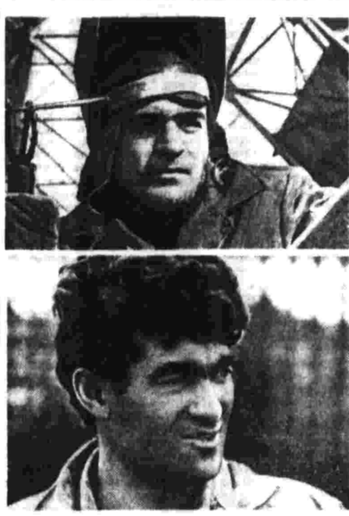
ФОТОТЕЛОПИСЬ ГОДА РАЗДАНСКИЙ ГИГАНТ