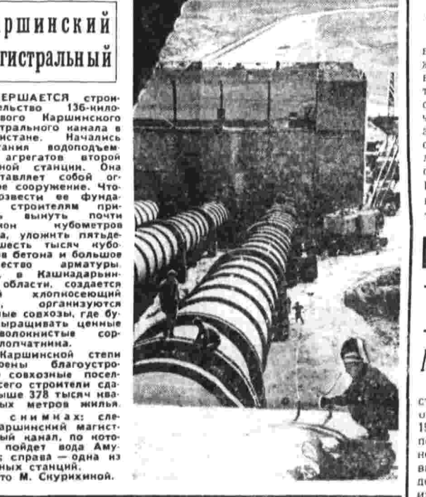
Завершается строительство 136-метрового Каршинского магистрального канала в Узбекистане. Начались испытания водоподъемных агрегатов второй насосной станции. Она представляет собой торсионное сооружение. Чтобы возвести ее фундаментом, строители применили новый способ — почти миллион кубометров бетона и большого количества арматуры.