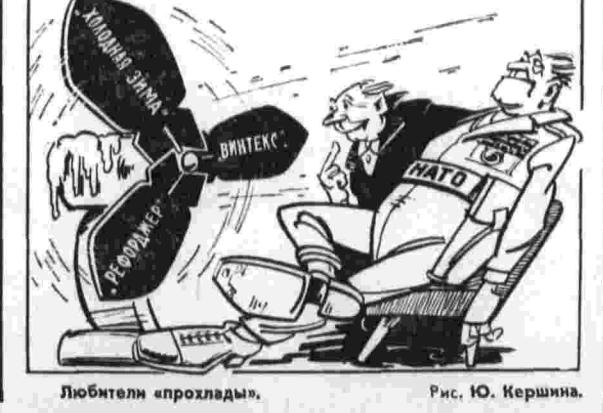
Любители «прохлады». Рис. Ю. Кершман.